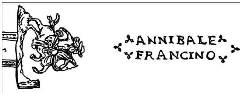
Рис. 3. Изображение всадника и подпись «ANNIBALE FRANCINO» на казенной части ствола (инв. № Ор-2347/1-2)

На стволах пистолетов (инв. № Ор-2346/1-2, Ор-2347/1-2) подпись ANNIBALE FRANCINO также сопровождается характерными