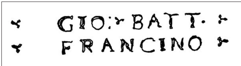
Рис. 4. Подпись «GIO. BATT. FRANCINO» на казенной части ствола (инв. № Ор-2597)

Ситуация с другим мастером из династии Франчино, подпись которого стоит на стволах еще одной пары пистолетов (инв. № Ор-2597, Ор-2598), представляется более сложной, чем в случае Аннибале. Если А. Гаиби выделял по меньшей мере четырех мастеров,