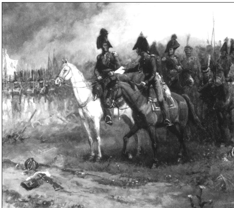
Рис. 3. «Фельдъегерь Н.И. Матисон вручает срочный пакет князю П.И. Багратиону. 1812 г.» Художник Чагадаев (1996)

М.И. Кутузов указал место своей Ставки и требовал от подчиненных ему генералов непрерывных донесений об обстановке через свой штаб.