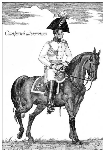
Рис. 2. Старший адъютант. 1812 г.

Предмет служения конвоя Главной квартиры требует, чтоб Офицеры онаго были с хорошими способностями и познаниями, унтер-офицеры грамотные, и если можно, знающие язык той земли, где война происходит, рядовые расторопные и вообще благонадежные. Все служащие в конвое Главной квартиры носят на касках, шапках и шляпах зеленую ветвь.