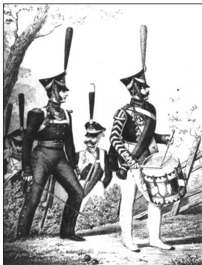
Рис. 4. Барабанщик лейб-гвардии Измайловского полка. 1812 г.

артиллеристам: «Подтвердить от меня во всех ротах, чтобы оне с позиций не снимались, пока неприятель не сядет верхом на пушки. Сказать командирам и всем господам офицерам, что отважно держась на самом близком картечном выстреле, можно только достигнуть того, чтобы неприятелю не уступить ни шагу нашей позиции. Артиллерия должна жертвовать собою, пусть возьмут вас с орудиями, но последний картечный выстрел выпустите в упор, и батарея, которая таким образом будет взята, нанесет неприятелю вред, вполне искупающий потерю орудий» (2). Русские артиллеристы выполняли этот приказ, о чем свидетельствуют донесения, отправляемые из батарейных рот в штабы бригад.