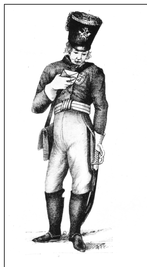
Рис. 5. Форма одежды почтальона начала XIX в.

Военная почта отправлялась в конкретные дни и часы, которые указывал начальник второго отделения дежурного генерала. Он же определял срочность пакета. Почтальоны доставляли пакеты с документами от одной станции до другой, где передавали их следующим почтальонам (рис. 5).