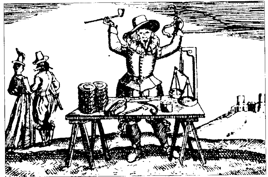
Торговец трубками и табаком. В левой руке — трубка, в правой — табак. На столе — весы, табак, трубки. Табак хранили в рулонах диаметром с запястье, а покуривали часто лeskями. С нем. гравюры на меди нач. XVII в.

Первые трубки делали руками. Около 1600 года появилась форма из двух частей из латуни, а вскоре из железа 16 . Ранние трубки сразу выделяются по величине, форме и тесту. Они имеют небольшую чашечку, с внутренним диаметром до 6 мм, с толстыми стенками из рыхлого, напоминающего мел теста, каблук широкий и практически не выступает, длина мундштука не превышает 15 см. Около 1640 года диаметр чашечки увеличился до 9 мм, длина мундштука — до 35 см, а также появился слабовыступающий круглый широкий каблук 17 . В конце XVII-XVIII веках в облике глиняных трубок произошли качественные изменения: стенки чашечек и мундштуков стали тоньше, в то время, как диаметр чашечки увеличился до 13 мм и более, а длина мундштука — до 60 см и более. Поверхность поздних трубок гладкая, с лоском. Это стало возможным в связи с изобретением джин-пресса 18 .