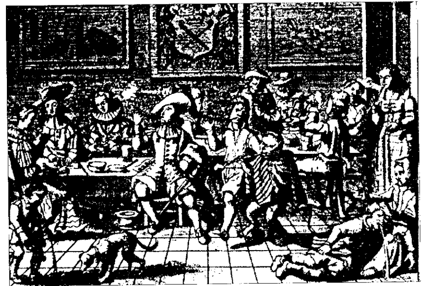
В кабаке. Голландская гравюра на меди 1628 г.