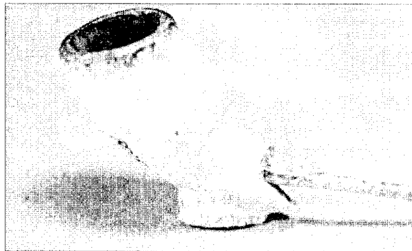
Чашечка глиняной курительной трубки XVII в.