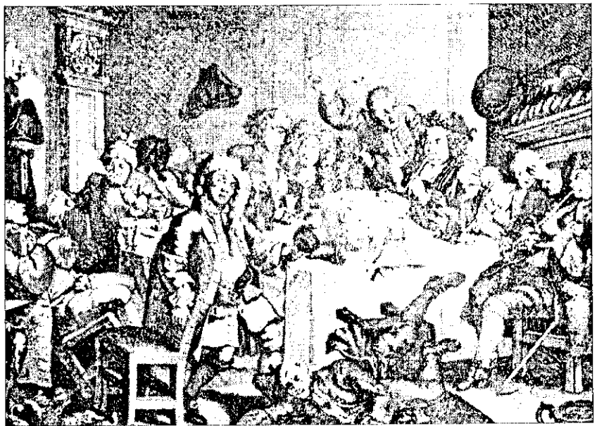
В кабаке. С гравюры XVII в.

Какие-либо сведения о курении в Выборге мне пока не встретились. Но обнаруженные при раскопках трубки красноречиво свидетельствуют о распространении курения и здесь. Известно, что курение быстрее всего распространялось в морской среде и портовых городах, каковым был и Выборг. Скорее всего, как когда-то легендарный выборгский крендель, первая курительная трубка появилась, возможно, с неким голландским господином, приплывшем на торговом судне. Трудно представить, что курение обошло стороной известный в Выборге «Погребок Антона Борхардта», открытый в построенном в 1653 году доме на улице Епископской (ныне Подгорная). Купцы собирались в погребеке за рюмкой вина для ведения переговоров и решения своих торговых дел, для совершения сделок с прибывающими в город немецкими и голландскими шкиперами 22 . В таких местах играли в кости и карты, спорили, слушали полуправдивые истории моряков и, вероятно, хотя об этом нигде прямо не сказано, курили. На картинах голландских и фламандских художников XVII века глиняная курительная трубка — неперемный атрибут интерьера кабака и характерных для такого заведения разгула и веселья.