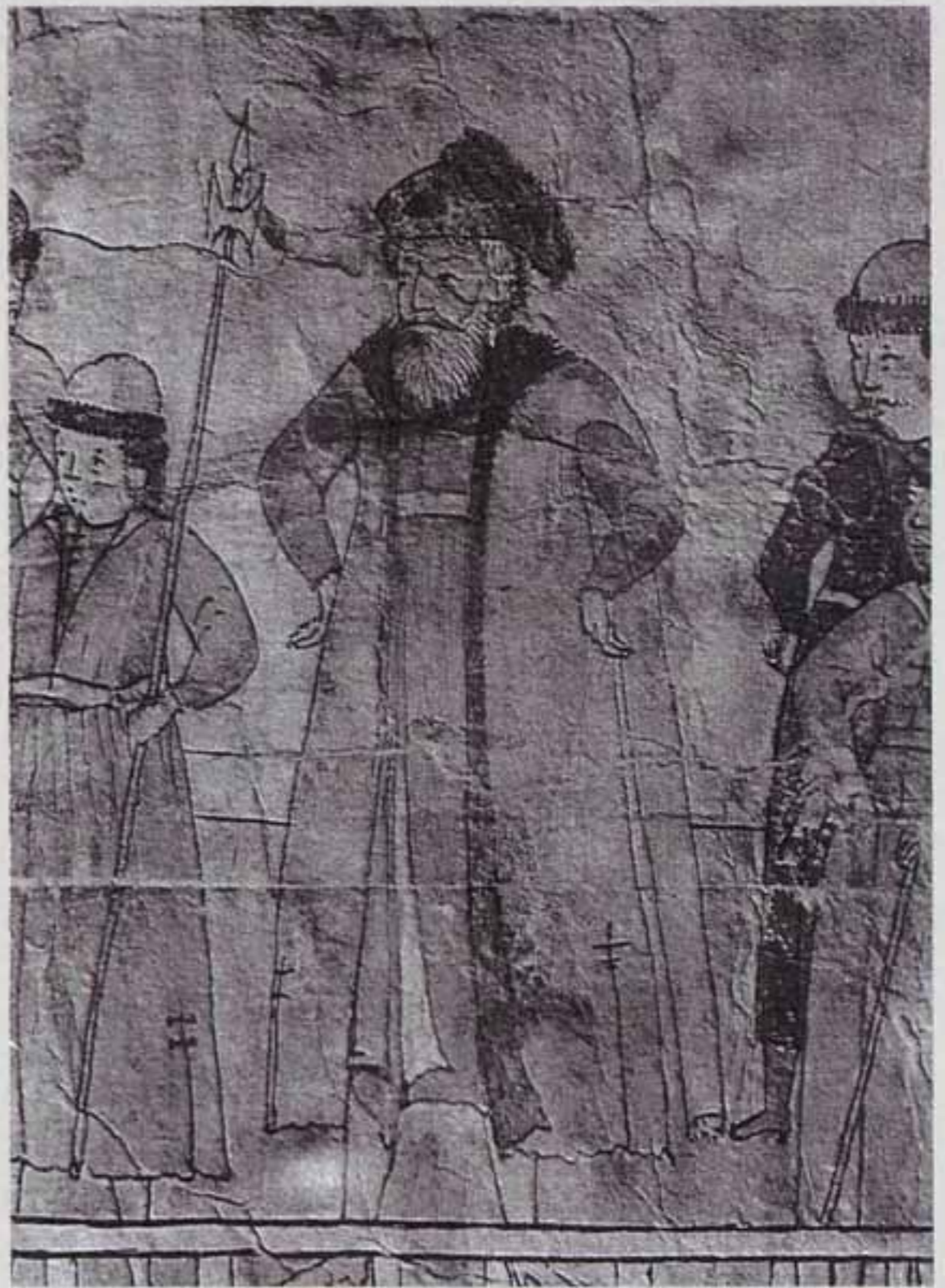
Чертёж изображения в лицах отпуски стрельцов в судах водяным путём на Разина (фрагмент)

ность творения в том, что показаны разные чины московских стрелецких приказов, причём не абстрактные образы, а едва ли не портретное отображение конкретных людей. В открытой печати рисунок полностью не воспроизводился никогда. В конце XIX века П. П. Пекарский опубликовал подробное его описание. Позднее были использованы два его фрагмента при составлении многотомного сборника «Очерки истории СССР. Период феодализма XVII в.», а также помещены фотографии отдельных его частей в статье З. И. Фомичёвой 10 . В дальнейшем свыше двух десятилетий он не привлекал внимания исследователей. Лишь в 1991 году Р. Паласиос-Фернандес создал серию графических реконструкций на основании материалов данного источника 11 , и в 2008 году в книге В. Кибовского «300 лет российской морской пехоте» повторили в цвете фрагменты этого рисунка из работы Фомичёвой.