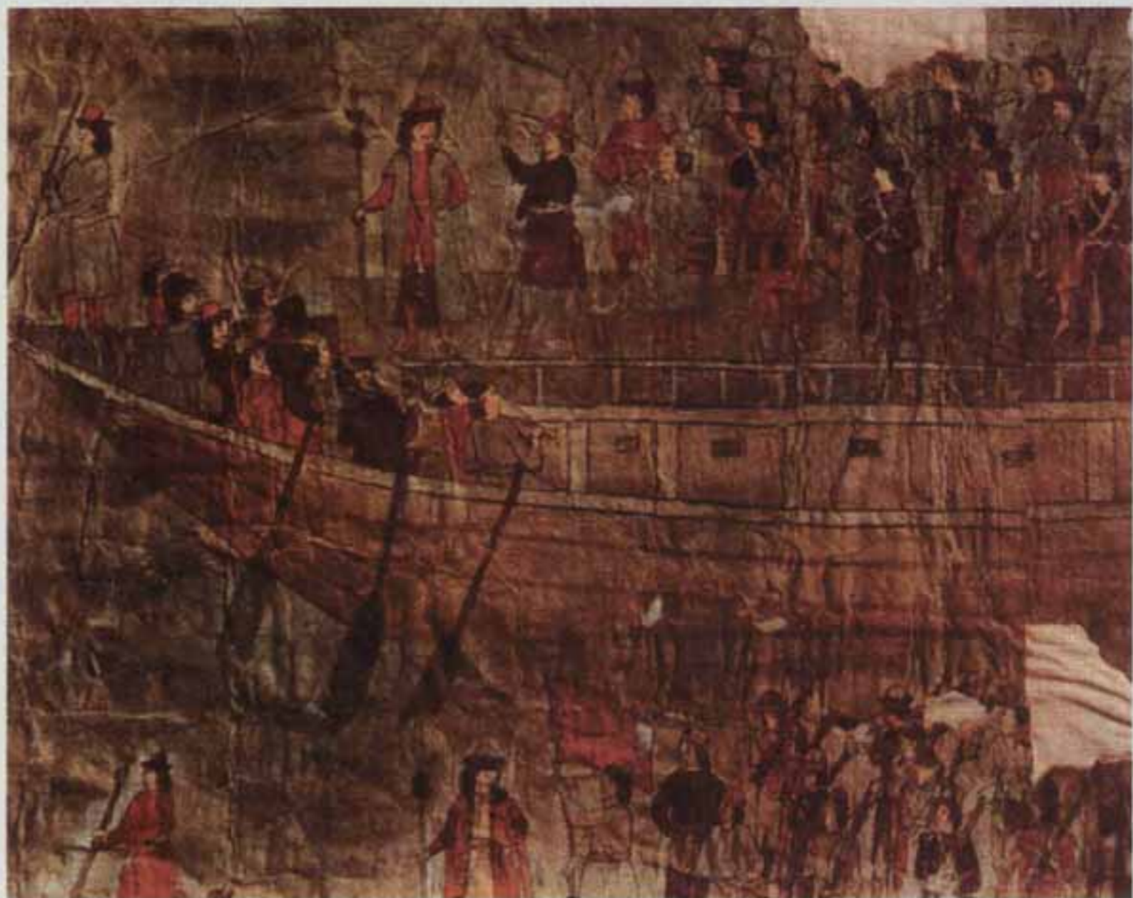
Чертёж изображения в лицах отпуски стрельцов в судах водяным путём на Разина. (Фрагмент)

У каждого мушкет, судя по форме ложи — западноевропейский, он либо в руках, либо на плече, а у одного из них — на погонном ремне за спиной. Сбоку на