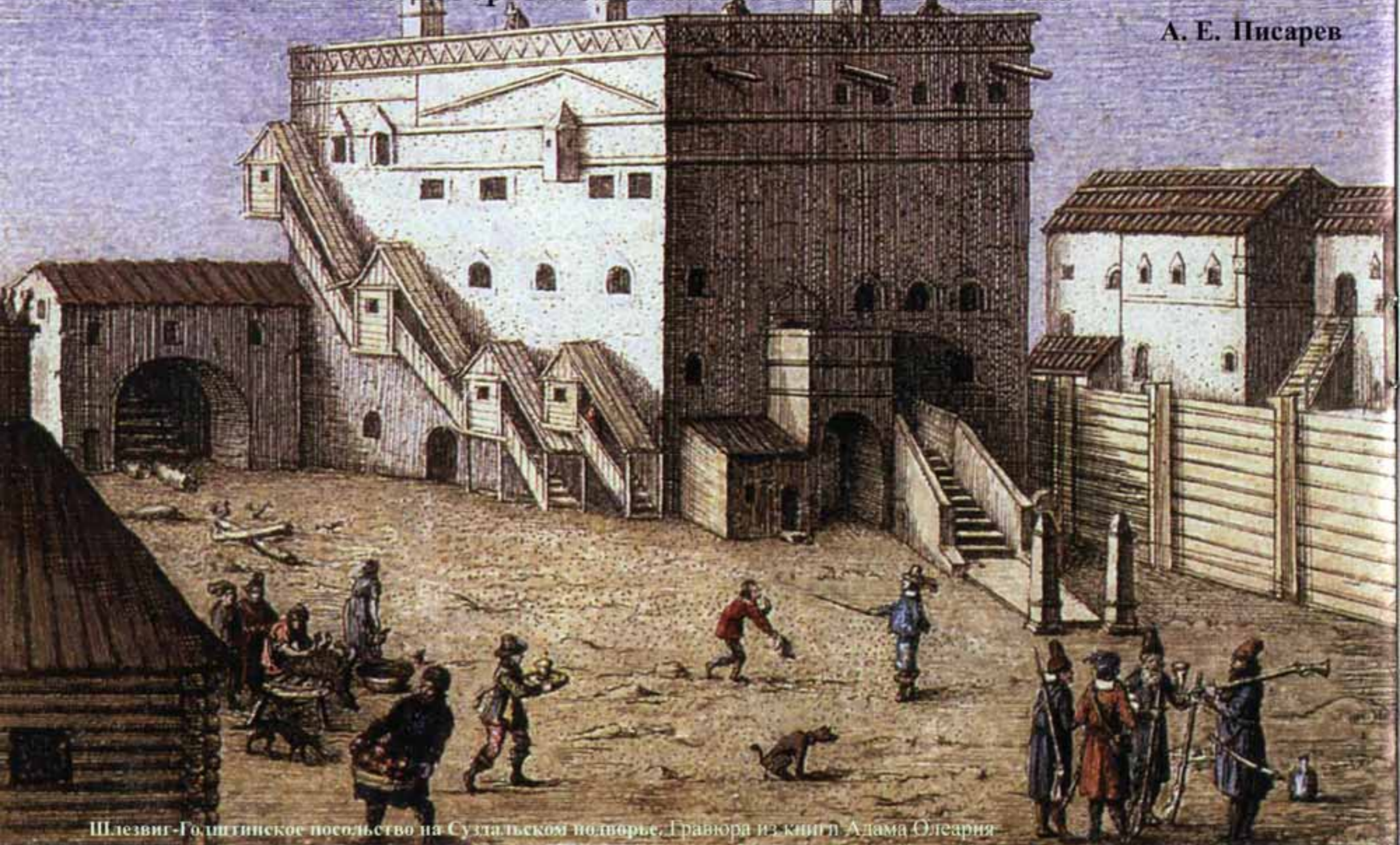
Шлезвиг-Гольштинское посольство на Суздальском поворье. Гравюра из книги Адама Олеария

В настоящее время наблюдается интерес историков и реконструкторов к «служилому платью» русской пехоты XVII века, в частности московских стрельцов. Однако до настоящего времени не обнаружено ни одного подлинного образца стрельцкого кафтана. Данные письменных источников очень разноречивы, и исследователи вынуждены обращаться к иконографическим, отображающим комплексы предметов, входивших в форму стрельцов, что даёт возможность более точно определить её внешний вид. Цель данной публикации — анализ известных документов, гравюр, миниатюр и пр., на которых представлены московские стрельцы, и на базе этого как можно достовернее воссоздать их «служилое платье», установить его разнообразие и видоизменение.