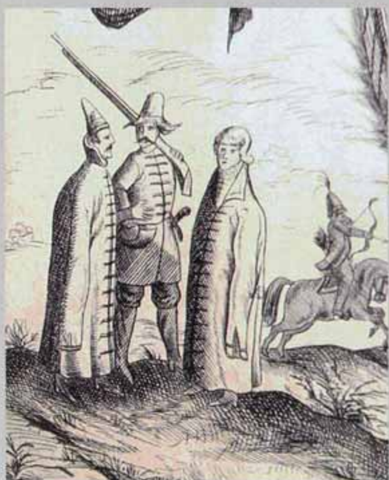
«Московские» типажи. Рисунок на Сигизмундов плане. Художник И. Абелин

осуществлялась только эстетическая правка. Отдельные из них впервые оказались в России в 1840 году и нашли отражение в работе А. В. Висковатова «Историческое описание военной одежды и вооружения российских войск, сделанное по Высочайшему повелению». В полном объёме альбом увидел свет только в 1898 году в Швеции, на русском языке издавался лишь частично. Весь альбом целиком был выпущен в 90-е годы XX века при содействии сотрудников Новгородского музея-заповедника 13 .