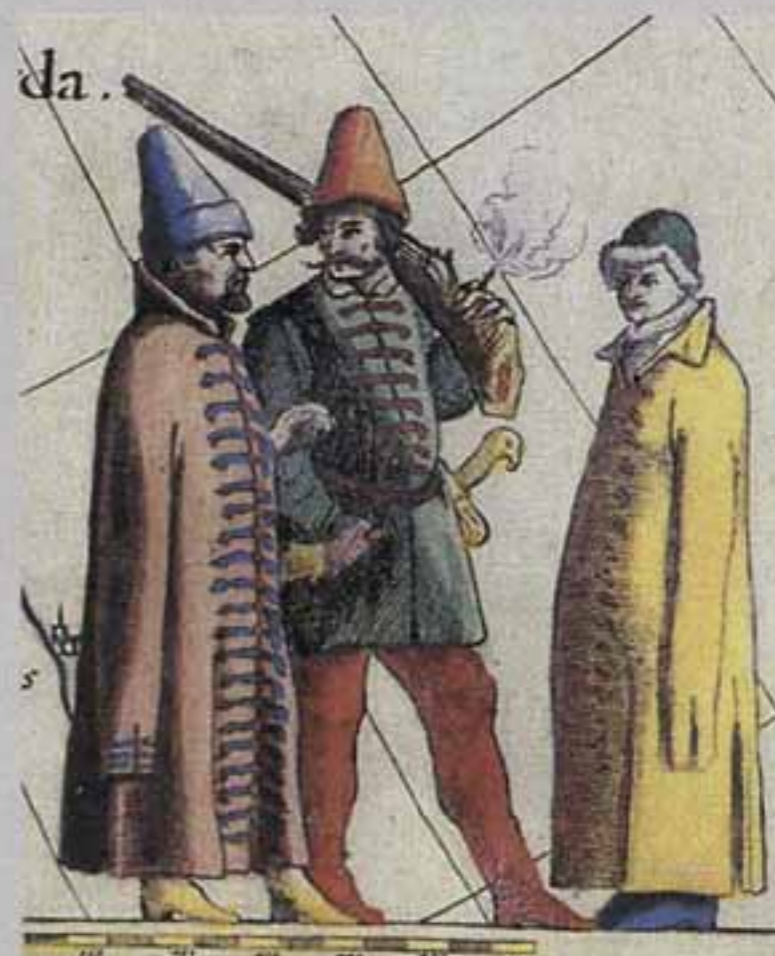
Фигуры, изображённые на Карте России, известной как «Борисов чертёж».

Завершает иконографический ряд, посвящённый московским стрельцам, цикл рисунков из эпиталамы Кариона Истомина «Книга любви знак в честен брак», написанной к свадьбе молодого Петра Алексеевича и Евдокии Лопухиной и поднесённой адресатам 30 января 1689 года. Эпиталама была создана в одном экземпляре и украшена мастерами Оружейной палаты. В открытой печати её факсимильное издание было предпринято только один раз — в 1989 году и остаётся единственным по сей день 15 .