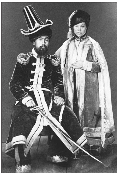
Рис. 3. Фотография знатного казаха с женой («киргизский хан с женой»), вторая половина XIX в.