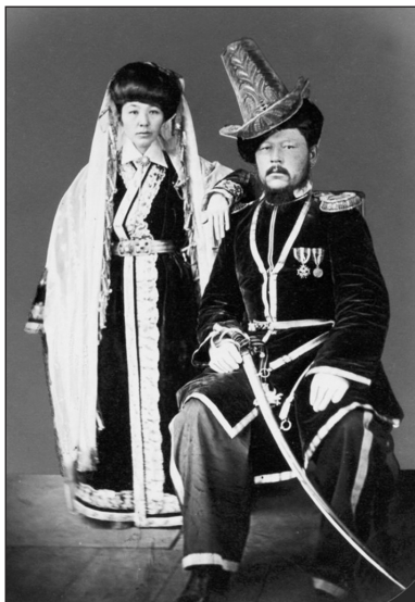
Рис. 2. Фотография знатного казаха с женой (г. Астрахань, 1873) РГО, Санкт-Петербург (РНБ, Д-К. – Б. м., 1873 г. Э АлТ 63/2-А 913 «Киргизский хан с женою». Светопись Вишневого)