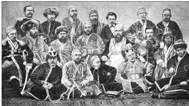
Рис. 4. «Депутация казахов Зайсанского края в Москве, имевшая счастье представляться Е. И. В.» 1873 г. (по: [Всемирная иллюстрация, 1873. Т. 9. С. 141])