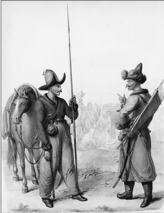
Рис. 1. Акварель Г. Опица (1775–1841) «Казак и башкир», начало XIX в. (частное собрание, Казахстан)

определение основных категорий потребителей данного клинкового оружия, фиксация типов российских сабель, применявшихся казахами в данный период.