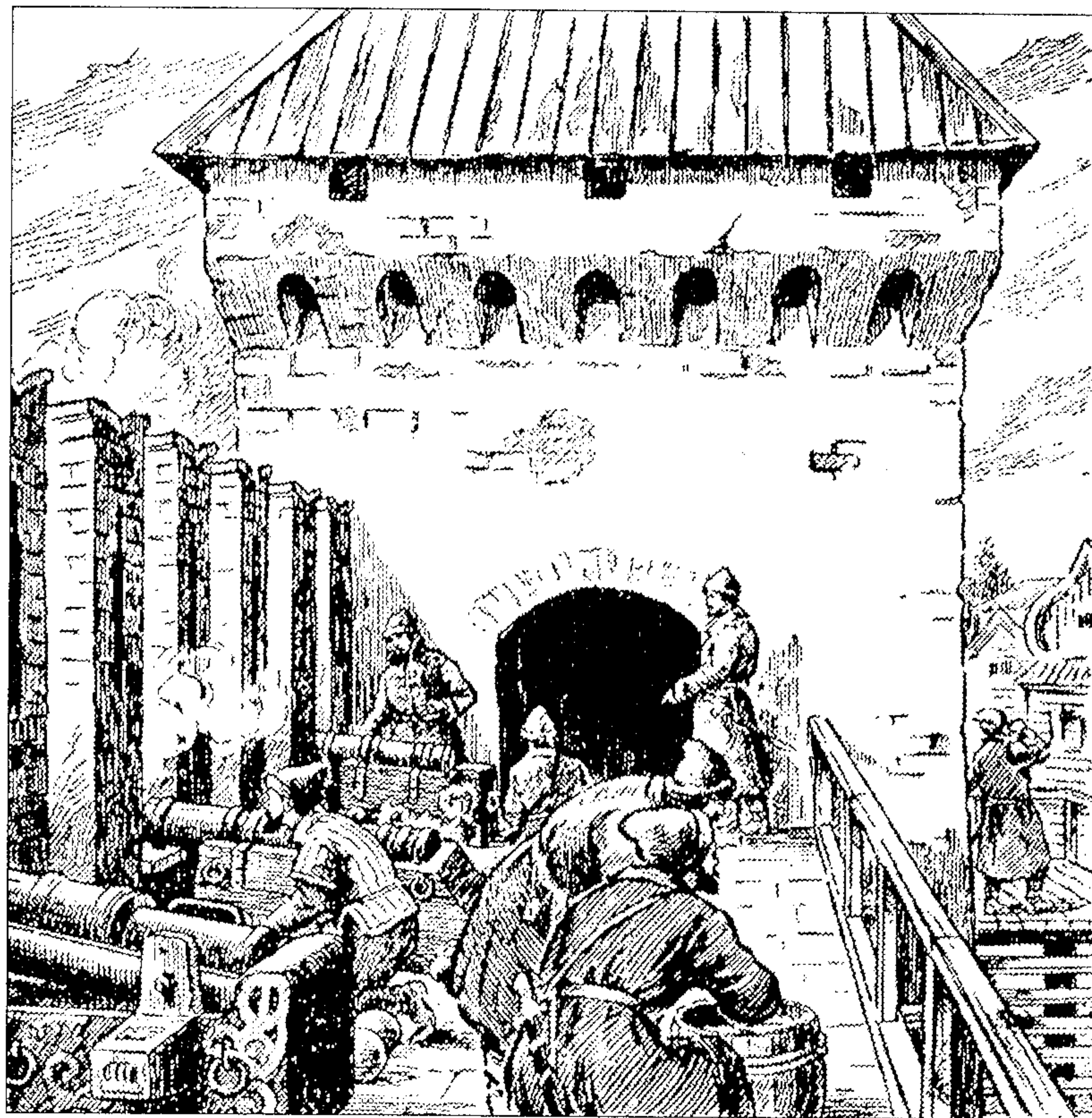
Крепостная артиллерия в действии

Приборные служилые люди Севского «острошка», среди которых непременно находились пушкарки, загишники и воротники, по