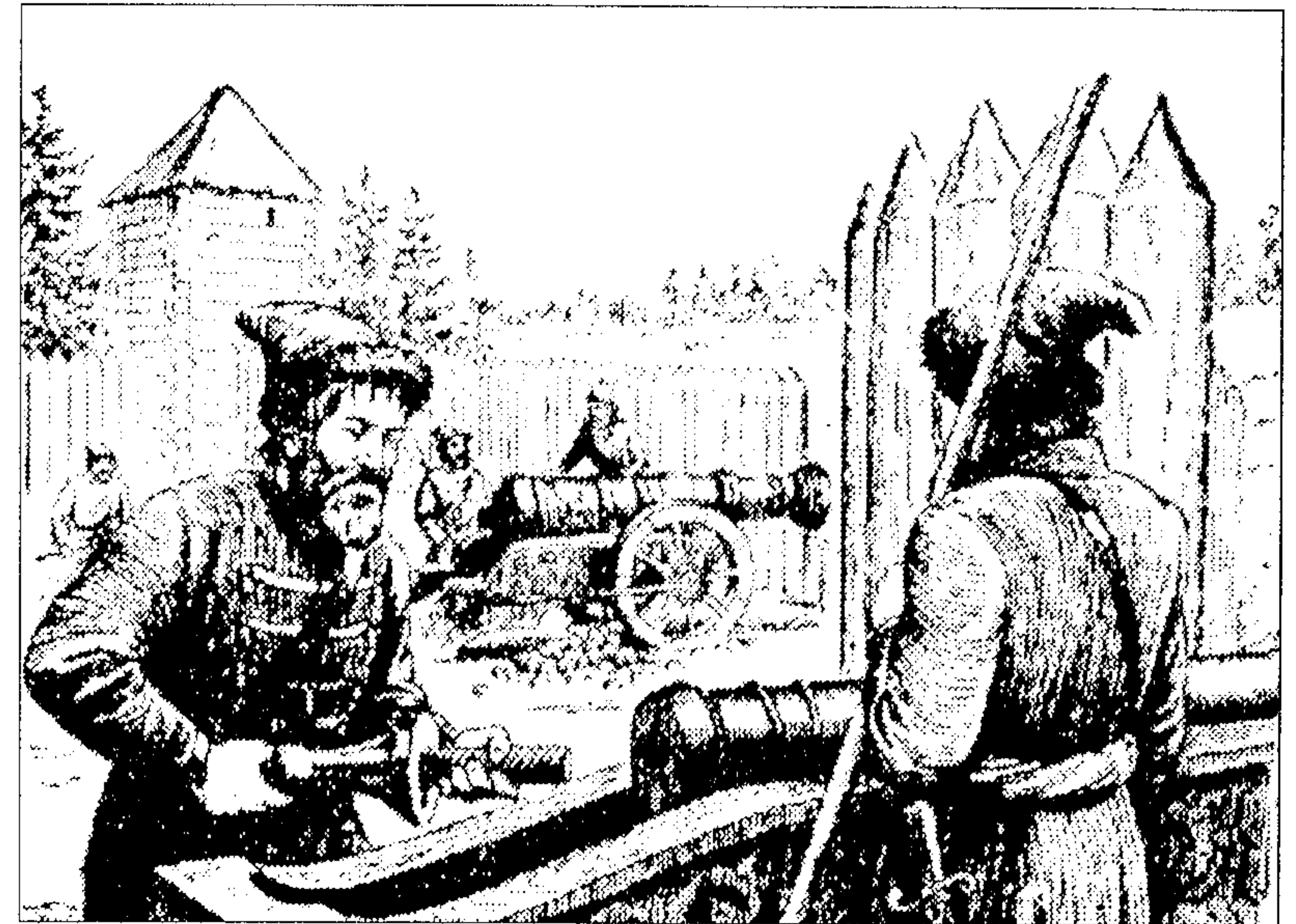
Русские пушкари XVII в.

За службу пушкари получали денежное и хлебное жалованье, а также земельные наделы (об этом подробнее скажем далее). В середине XVI в. московские пушкари получали по 2 рубля в год, по осьмине муки и по полпуда соли в месяц. Помимо этого, они получали на обмундирование «по сукну по доброму, цена по 2 рубля». В походах пушкари получали дополнительное хлебное довольствие.