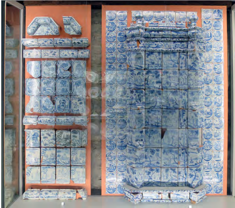
Ил. 7. Печь и плитка в экспозиции Таллинского городского музея. Происходит, по легенде, из дома купца Генти на улице Суур в Нарве. Общий план

экспозиции идентичен тип углового мотива, манера и линия его рисунка, сюжеты изображения в большом круге — библейские, рисунки в большом круге также совпадают по качеству исполнения.