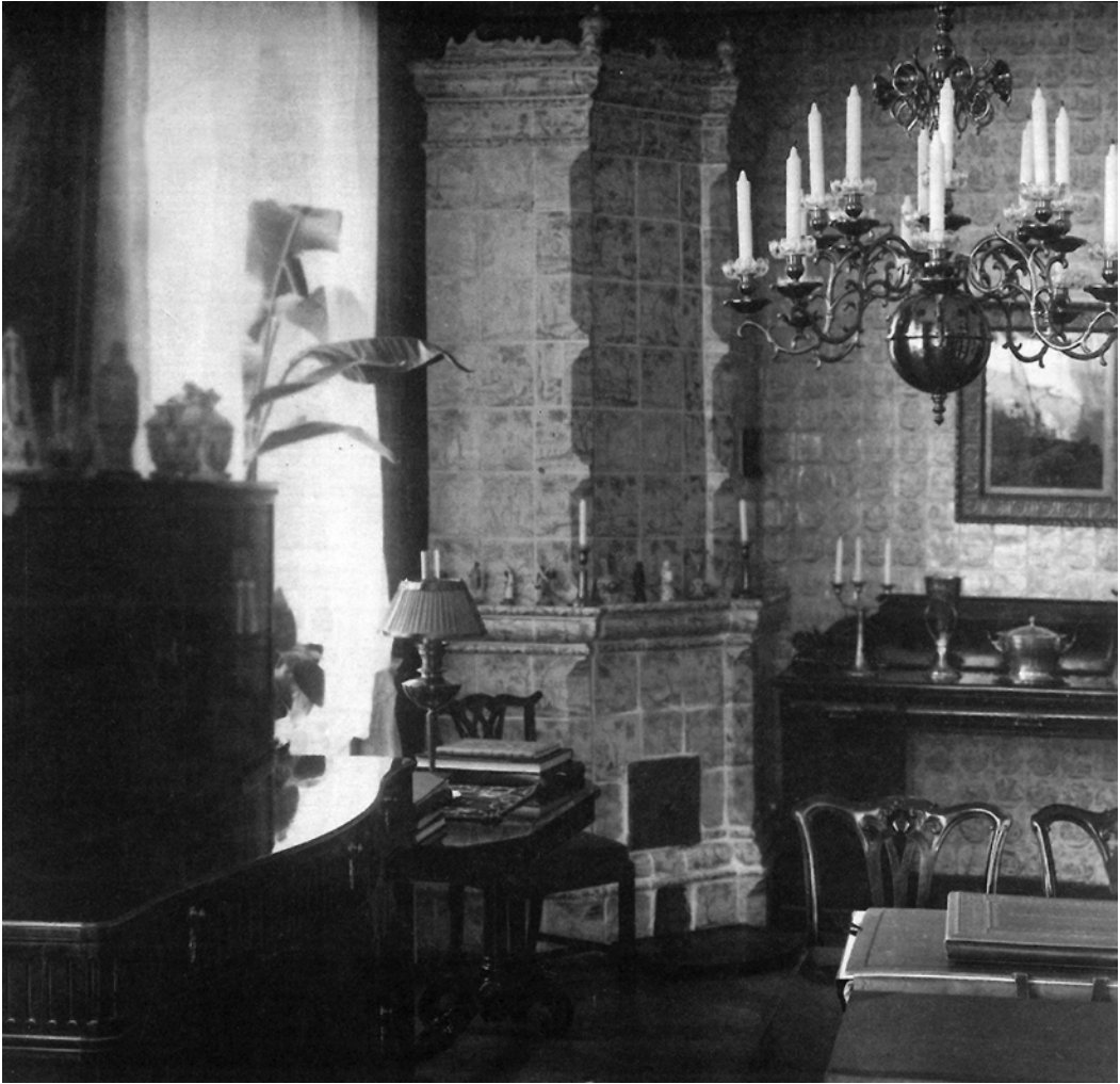
Ил. 9. Фотография возможного интерьера Дома Петра I. Из издания «Изменяя прошлое будущего» ( Juhan Maiste, Matis Rodin, Madis Roosalu . Каталог / koostajad [Tallinn]: Eesti Kunstiakadeemia Restaureerimiskool, 2005. – 111 lk. : il. С. 50)

голландскими плитками. В отличие от предыдущей упоминаемой фотографии печи «из Дома Петра I», опубликованной в 2005 г., печь не привязывается Конрадом Штраусом к конкретному дому. В подписи к иллюстрации (tafel 96,1) он обозначает её как «печь из одного из домов Нарвы». Более подробные фотографии той же печи приводятся в его книге, в таблице под номером 99. По рисункам на изразцах с этой страницы и по описанию, приводимому на странице 170, где говорится и о голландской плитке, окружающей печь, становится понятно, что это печь из нынешней экспозиции Таллинского городского музея. К. Штраус, работавший в годы Второй Мировой войны в Нарве, в музее 16 , не мог неправильно описать интерьеры Дома Петра I, то есть приписать интересующую нас печь и