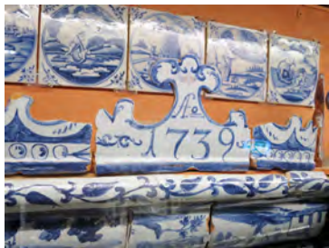
Ил. 8. Центральный изразец с датой от печи в экспозиции Таллинского городского музея. Происходит, по легенде, из дома купца Генти на улице Суур в Нарве

XVIII в. в Нарве были мастера, которые занимались изготовлением и росписью изразцов, и возможно, это печь местного производства 7 . Плитка, обрамляющая её на стенах, относится по времени изготовления к 40-м годам (Амстердам) 8 , что логично совпадает со временем изготовления печи. На ней изображены библейские сюжеты и пасторальные сцены, вписанные в большой круг, угловое заполнение у всех — «голова быка». Исследователи керамики считали, что печь «с улицы Суур» происходит из дома Петра I. Возможно, печь была установлена в доме Петра I в то время, когда в нём жил комендант Нарвы. Затем, до 1865 г., когда Дом перешёл в ведение Нарвского археологического общества 9 , она могла быть перенесена в дом торговца Генти, что отчасти подтверждается совпадением плиток с археологическим материалом.