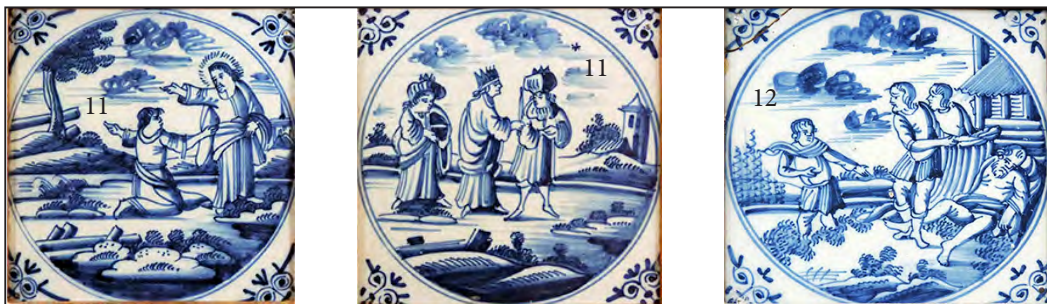
Ил. 11–12. Плитка из церкви в местечке Тудулинна (Эстония). Современное состояние

голландскую плитку другому помещению. Следовательно, в 1937 – 1939 годах «наша печь с плиткой» находилась уже в доме купца Генти. Если и происходило её перемещение из Дома Петра I, то ранее. Прямым доказательством того, что она находилась в Доме Петра I, может служить только идентичность археологических плиток с экспонируемыми. Однако они являются тиражным материалом, поэтому это доказательство не бесспорно.