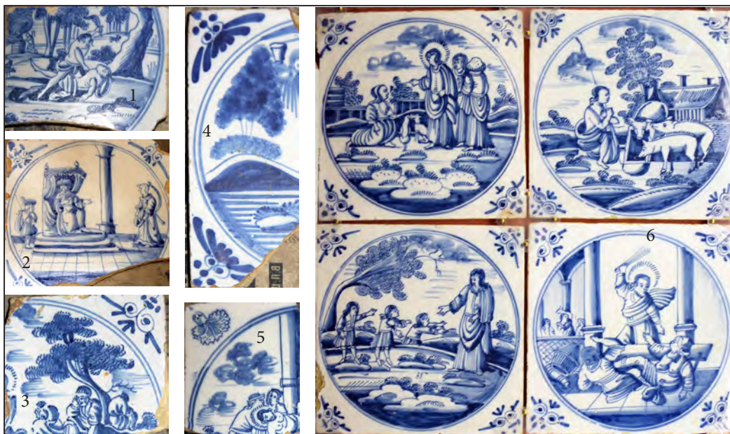
Ил. 1–6. Плитки из фондов Нарвского музея (происходят, по легенде, из Дома Петра I): 1) Убийство Авеля Каином 2) Угловое заполнение – «голова быка». Роттердам. 1725 – 50-е годы XVIII в. 3) Угловое заполнение – «голова быка». Амстердам. 40-е годы XVIII в. 4) Угловое заполнение – голова быка. Харлингген. Вторая половина XVIII в. 5) Угловое заполнение – «гвоздика». Амстердам, 40-е годы XVIII в. (Фото автора). 6) Плитка в экспозиции Таллинского городского музея (происходит, по легенде, из дома купца Генти на улице Суур в Нарве). Детали (Фото А.В. Серова)

с угловым заполнением «гвоздика». Время и место изготовления их варьируется с 1725 до 50-х годов (Роттердам) 3 , 40-е годы (Амстердам), 90-е годы (Харлингген) XVIII в. Все три типа плитки с угловым заполнением «голова быка» сделаны в разных городах. Самый ранний, более тонкой кисти в росписи и с угловым заполнением, изготовлялся в Роттердаме ( Ил. 2 ) 4 ; второй с угловым заполнением более широких и грубых линий, выполнен в Амстердаме в 40-е годы ( Ил. 3 ); третий тип плитки с угловым заполнением «голова быка» сделан в Харлинггене во второй половине XVIII в. ( Ил. 4 ). Плитки с угловым заполнением «гвоздика» сделаны в Амстердаме в период 20 – 50-х годов ( Ил. 5 ) 5 .