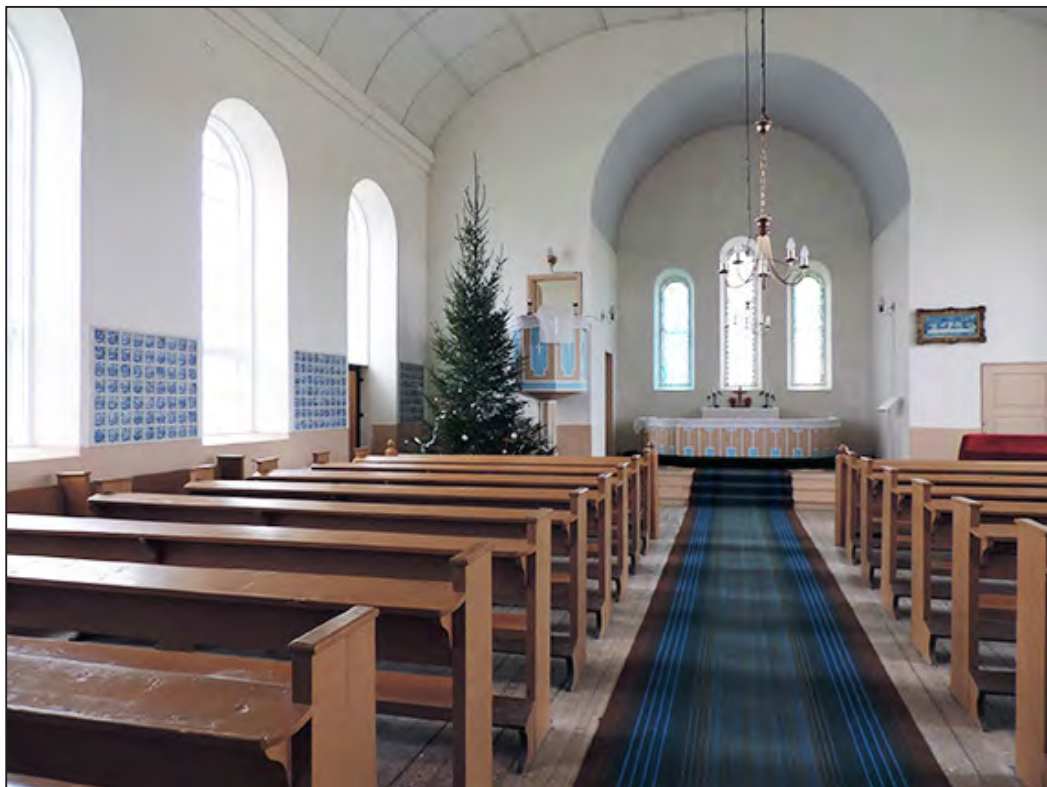
Ил. 10. Интерьер церкви в местечке Тудулинна (Эстония). Современное состояние

голландскую плитку другому помещению. Следовательно, в 1937 – 1939 годах «наша печь с плиткой» находилась уже в доме купца Генти. Если и происходило её перемещение из Дома Петра I, то ранее. Прямым доказательством того, что она находилась в Доме Петра I, может служить только идентичность археологических плиток с экспонируемыми. Однако они являются тиражным материалом, поэтому это доказательство не бесспорно.