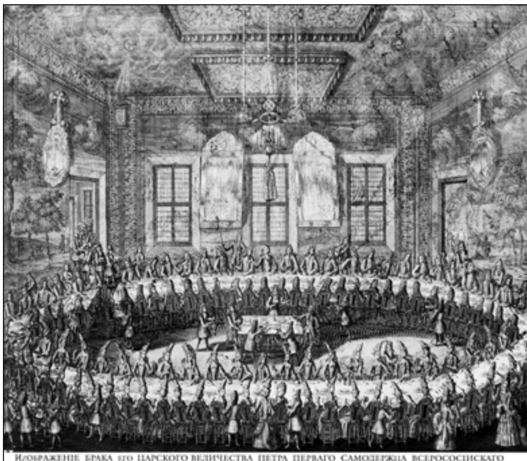
Ил. 1. А.Ф. Зубов. Свадьба Петра I и Екатерины I 19 февраля 1712 года. 1712 г. Бумага, офорт, гравюра резцом. (Из коллекции Государственного Эрмитажа)

Во время реставрации, «при разборке заполнения подоконных ниш на оконных откосах, кое-где были найдены остатки облицовки из голландских фаянсовых плиток» 6 , что также говорит в пользу версии об их появлении в Зимнем дворце Петра I еще в 1711 г.