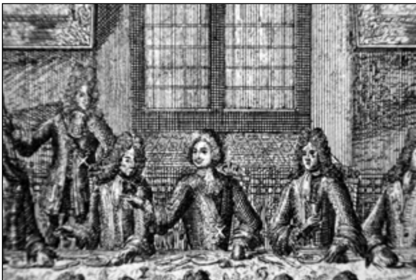
Ил. 2. А.Ф. Зубов. Свадьба Петра I и Екатерины I 19 февраля 1712 года. (Фрагмент). 1712 г. Бумага, офорт, гравюра резцом.

Опытные русские образцы фаянсовой плитки были обнаружены в 1976–1978 годах во время реконструкции Эрмитажного театра при разборе завалов в его подвале. Туда были снесены все сбитые во время ремонта 1763 г. 11 изразцы и плитки из Зимнего дворца Петра I. Черепок русской плитки толще, отличается от голландской составом эмали, стилем росписи, тесто серое с красными и желтыми вкраплениями. Проведение химико-технологической экспертизы, сравнивающей эталонные голландские экземпляры и найденные русские образцы, также выявило отличия в составе эмали и глины 12 . Судя по малочисленности найденных фрагментов, попытка заменить голландскую плитку русской не осуществилась.