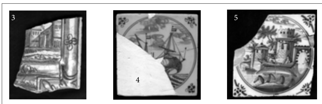
Ил. 3–5. 3) Русская плитка. 1710–1740 г. Керамика. 4) Голландская плитка. Корабль, закомпонированный в круг с угловым заполнением «голова паука». 1710–1724 г. Керамика. 5) Голландская плитка. Пейзаж в большом круге с угловым заполнением «голова быка». 1710–1724 г. Керамика. (Из коллекции Государственного Эрмитажа)

Отдельвали плиткой помещения русские мастера Яков Обресков и Никита Смирнов под руководством специально приглашенного голландского мастера 19 .