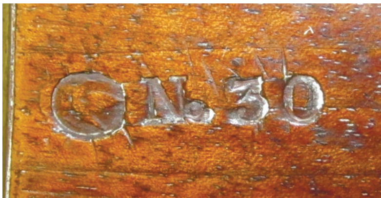
Ил. 4. Инвентарный номер императорской Рюст-камеры на прикладе ружья