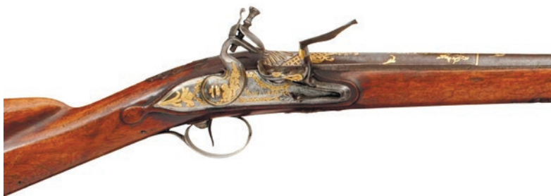
Ил. 3. Замок ружья

Кристи, верхняя часть курка (верхняя губка и, вероятно, курковый винт) не оригинальны, с чем можно согласиться, поскольку на верхней губке отсутствует таушированный золотом декор и есть лишь простая гравированная кайма (ил. 3).