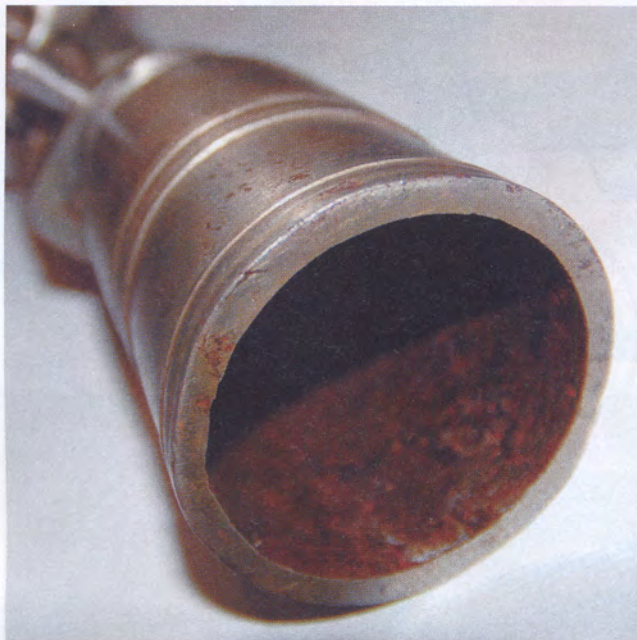
ДУЛЬНЫЙ СРЕЗ АНГЛИЙСКОЙ ТРЁХФУНТОВОЙ МОРТИРКИ