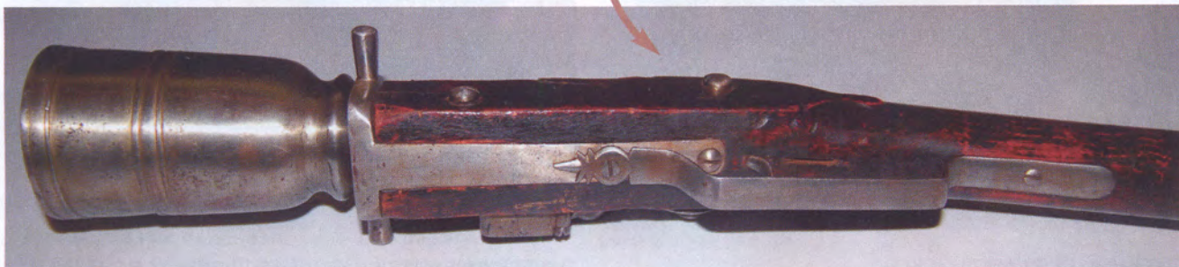
АНГЛИЙСКАЯ МОРТИРКА. ВИД СНИЗУ. ПО БОКАМ ВИДНЫ «УКЛЮЧИНЫ» ДЛЯ СТРЕЛЬБЫ СО СПЕЦИАЛЬНОЙ ПОДСТАВКИ (ВНИЗУ)

попала к его фаворитам – князьям Долгоруким и только во время императрицы Анны Иоанновны возвратилась в императорскую коллекцию.