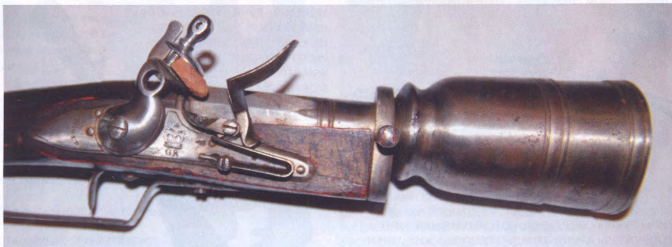
УДАРНО-КРЕМНЁВЫЙ ЗАМОК И СТВОЛ ДРАГУНСКОЙ МОРТИРКИ

Ложа мортирки сделана из древесины яблони и имеет широкий приклад с длинной шейкой. На затылке ложи выполнен поперечный вырез. Ствол крепится к ложе массивной железной обоймой с двумя цапфами.