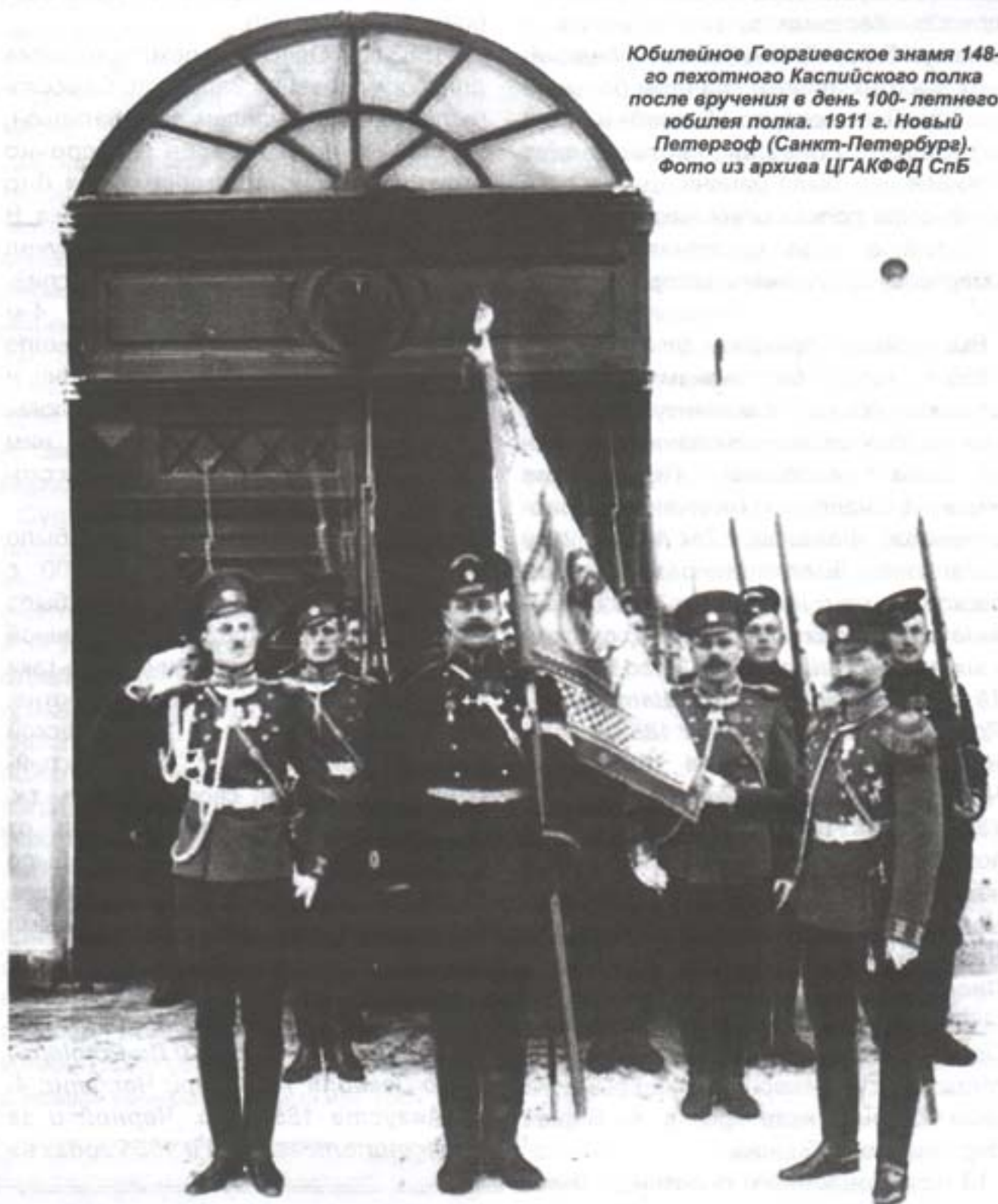
Юбилейное Георгиевское знамя 148-го пехотного Каспийского полка после вручения в день 100-летнего юбилея полка. 1911 г. Новый Петергоф (Санкт-Петербург).

В первой части статьи (Military Крым, №10) на стр. 20 допущена опечатка: в тексте «...уже 22 сентября 1856 года Высочайшим приказом императора Александра I...» необходимо читать «...1855 года».