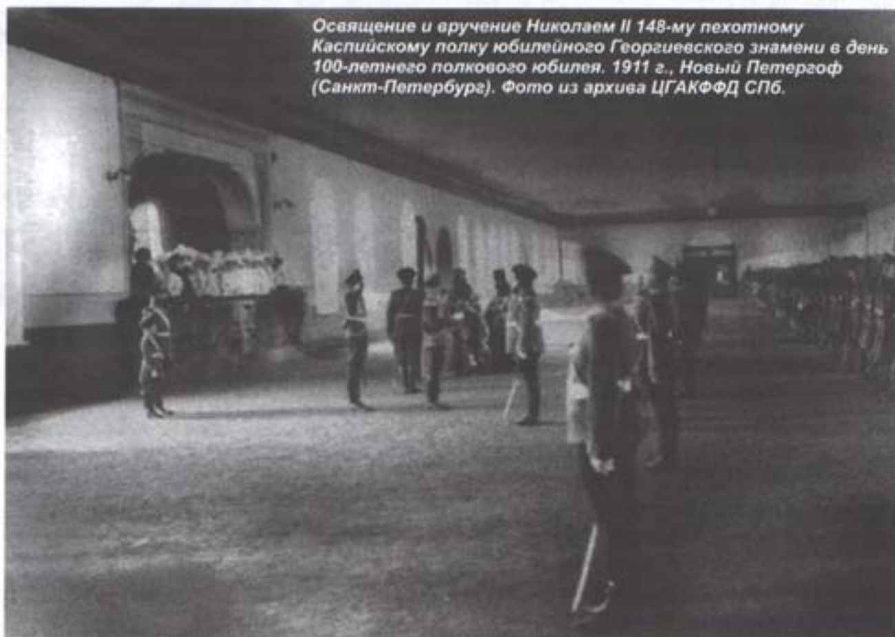
Освящение и вручение Николаем II 148-му пехотному Каспийскому полку юбилейного Георгиевского знамени в день 100-летнего полкового юбилея. 1911 г., Новый Петергоф (Санкт-Петербург).

поля, но и в ходе сражения на Черной речке 4 августа 1855 г. В этом сражении одесцы первыми захватили артиллерийскую батарею союзников на Федюхиных высотах, понеся при этом большие потери. Полк потерял 35 штаб- и обер-офицеров, большая часть солдат погибла или была ранена, включая и командира полка полковника Скюдери, который в ходе сражения получил смертельное ранение и вскоре скончался 2 .