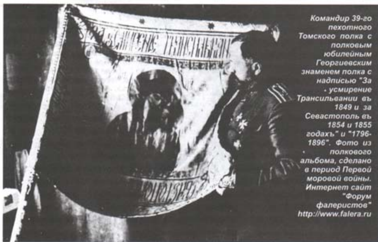
Командир 39-го пехотного Томского полка с полковым юбилейным Георгиевским знаменем полка с надписью "За усмирении Трансильвании въ 1849 и за Севастополь въ 1854 и 1855 годах" и "1796-1896". Фото из альбома, сделано в период Первой мировой войны.

верхняя часть венка имела разрыв в котором помещалась большая императорская корона. Знаменное древко окрашивалось в первом полку дивизии в желтый цвет, в третьем в белый, во всех остальных полках и частях в черный.