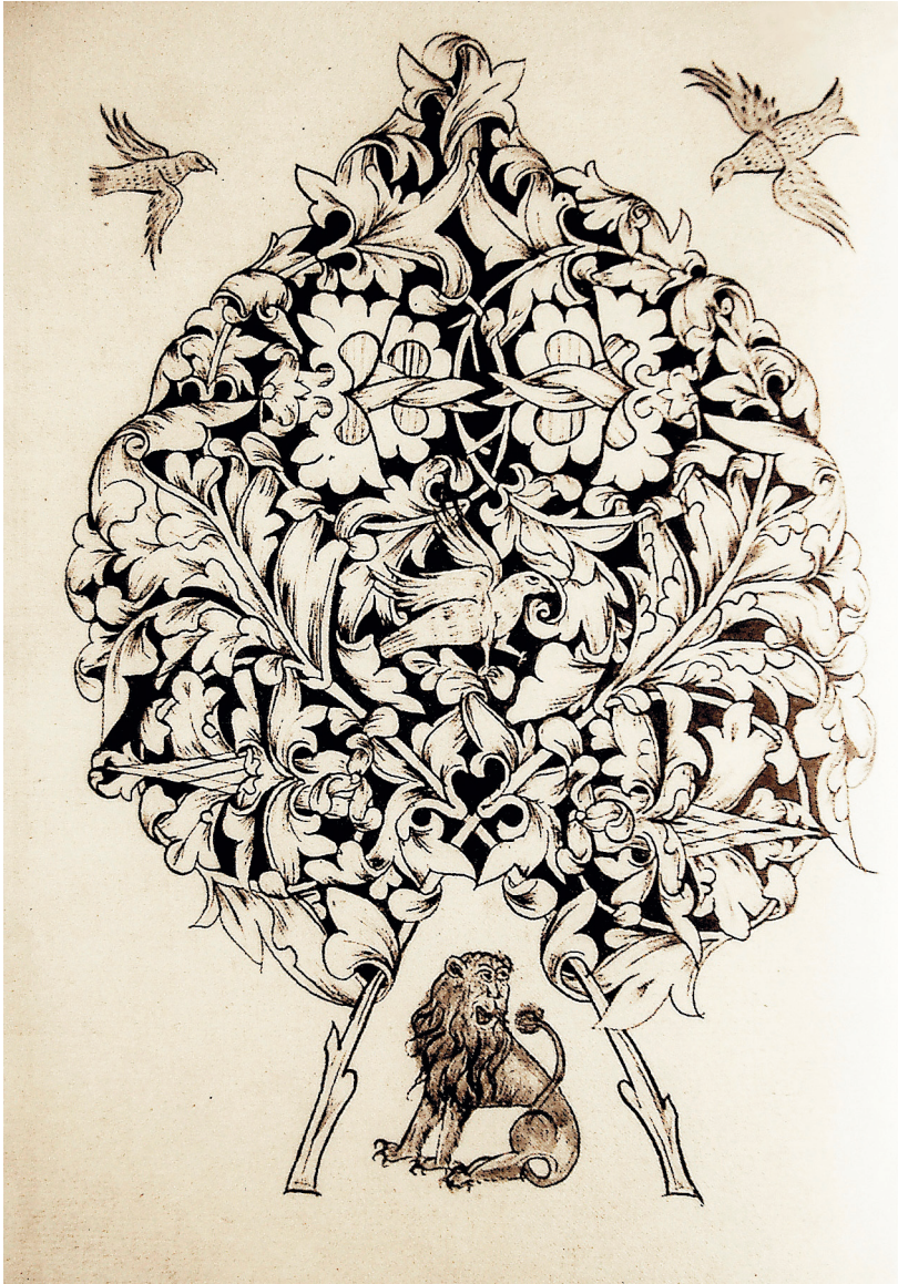
4. Федор Басов. Фантастическое древо из Ирмология певческого. 1590-е гг. [ГРМ, Др. Гр. № 19, л. 164 об.]