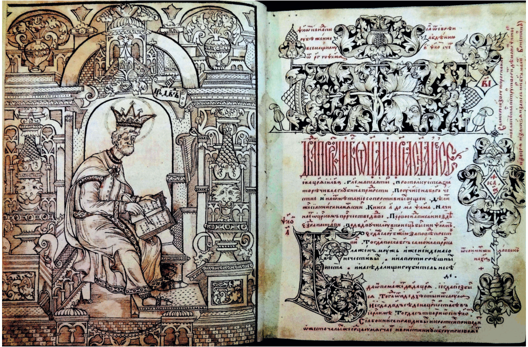
1. Федор Басов. Форзац к Псалтыри [РГБ, ф. 98, д. 453, л. 12 об.–13]