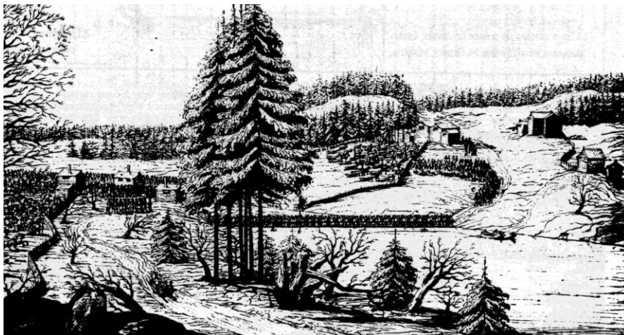
Рис.4. Переправа в Муравейне 1672 г. Фрагмент рисунка Э.Пальмквиста. Пальмквист 1993.