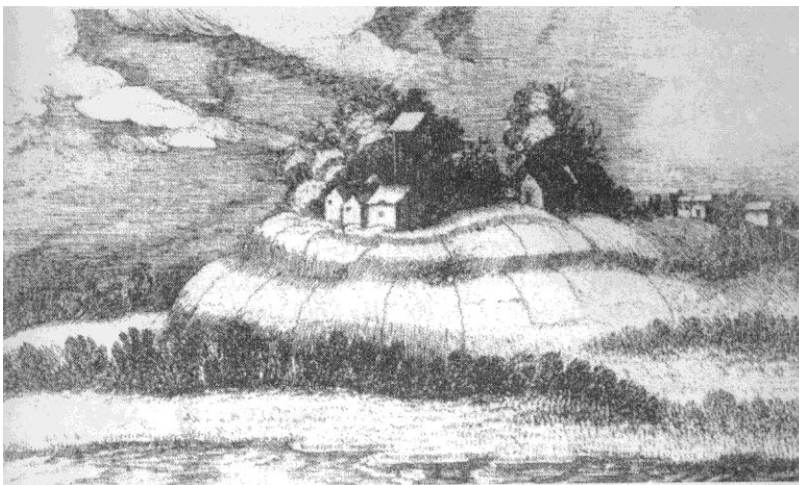
Рис.3. «Боярский двор» в Тесово. Рисунок Антониса Хутериса 1615г. Селин, Магола 2001.

Городище расположено на мысу образованном излучиной р. Лавы, с напольной стороны площадка ограничена невысоким валом и рвом. В ходе исследований 1976 г. производилась зачистка торца вала, в результате которой были прослежены три этапа его сооружения. По мнению В.П. Петренко наиболее ранний этап относится к XII веку, следовательно укрепления XVII в. возводились на валу укрепления древнерусского времени. Примитивная конструкция вала и общая планировка укрепления как будто подтверждают эту версию, но необходимо отметить, что датировка Петренко строится на основе единственного найденного фрагмента керамики с линейно-волнистым орнаментом, обнаруженным к тому же за пределами вала, а также, на факте существования названия деревни «Городище» еще в XVI столетии 44 . Остальной материал исследований 1976 и 2002-2003 гг. не выходит за пределы XVI-XVII вв., причем материалы с площадки городища относятся только к XVII в. 45 .