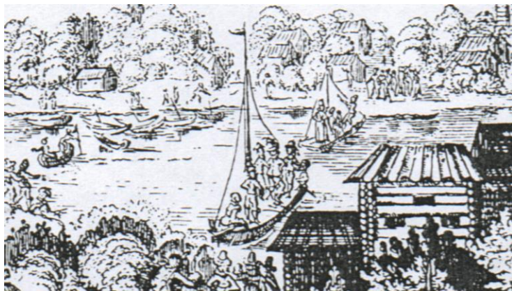
Рис. 2. Переправа через Лаву в 1634 году. Рисунок Адама Олеария. (Олеарий 1906).

время виденную им Лавуйскую заставу описал достаточно подробно.