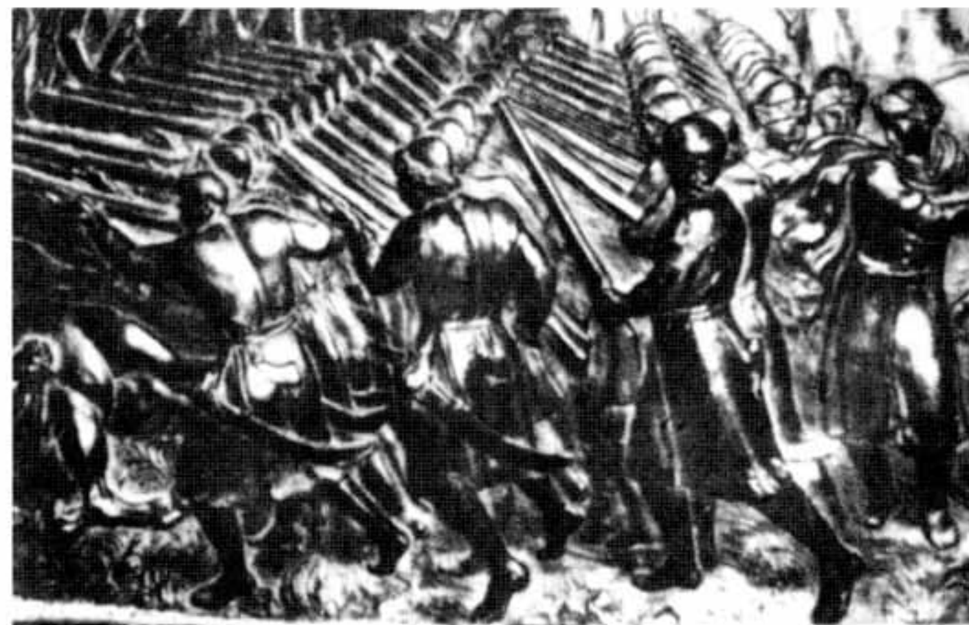
Іл. 1. Бойовий стрій козацької піхоти. Фрагмент барельєфа на саркофазі польського короля Яна Казимира в церкві Сен-Жермен де Пре у Парижі, що зображає битву під Берестечком 1751 р. Скульптор Ж.Тібо, 1672 р.

Козацьким рушницям на відміну від рушниць армій інших європейських країн властиві були застарілі, характерні для середини XVII ст. форми і оздоблення. Вони мали ложе довге з підцівником на всю довжину цівки, виготовлене з деревини клена чи берези й прикрашене вставками з чорного дерева, кістки й мушель, традиційний короткий і вузький аркебузний багатопрофільний приклад із шухлядою (гніздом) для рушничного приладдя (флейтухів, сала та кременів) (іл. 1). У вітчизняних писемних джерелах XVII–XVIII ст. такий тип рушниць дістав назву “ручниця” (див. Додаток ). Козацькі ручниці зазвичай оснащувалися недовгими, надзвичайно відпорними цівками східного виробництва, з невеликим потовщенням у дульній частині, завдовжки 800–1090 мм і калібром 12–16,5 мм, виготовленими з так званого червоного заліза (цівки робили з литого “витого” булату й зварювали на відміну від простих цівок спіраллю, а не вздовж, завдяки чому вони зазнавали розриву рідше 10 ), із гладким або нарізним каналом, з 6–8 півкруглими гвинтовими нарізами. Загальна довжина рушниць коливалась від 110 до 136 см, вага сягала 4 кг. Найчастіше до козацьких рушниць використовували замки англо-голландського типу. Меншу популярність мав