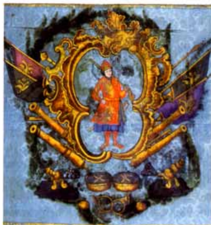
Іл. 5. Прапор Сенчанської сотні Лубенського полку, 1760-ті рр. XVIII ст. Фрагмент. Національний музей історії України

на заміну зношеного й пошкодженого, показують повний склад збройових речей виборних козаків у 60–70-х рр. XVIII ст. Наприклад, серед похідних “воїнських ісправностей” козаків Лубенського полку (1768 і 1774 рр.) називаються карабін, ладунка, перев'яз з погонним гаком і жовтим прибором (пряжкою і наконечником), нагалище, сумки ремінні, натруска з порохом, ріг пороховий, 40–50 куль, 3 фунти пороху, спис, шабля, нагайка (канчук). Деякі козаки замість карабіна мали “ружо донское”. Під “донською” рушницею, вочевидь, треба розуміти рушницю кавказького типу, що була на озброєнні в донських, а