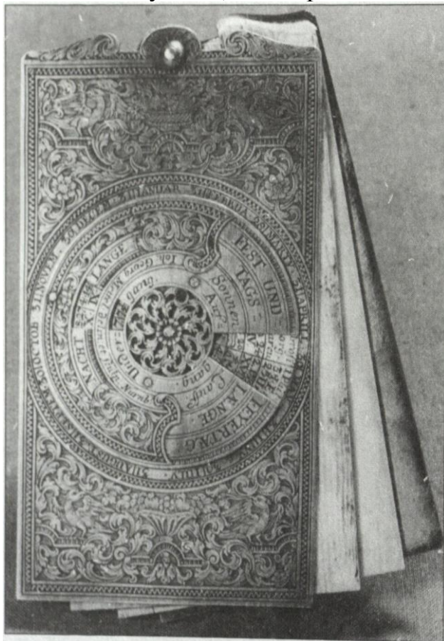
3. Календарь. Нюрнберг, до 1738 г. Мастер Иоганн Георг Меттель. Музей декоративно-прикладного искусства, дворец Пилльнитц, Дрезден

которые вышли из мастерской нюрнбергского гравера по серебру Иоганна Георга Меттеля и несут его подпись (ил. 2). Календари, про которые доподлинно известно, что их гравировал Меттель, находятся в собраниях музея замка Готы 5 , в музее Кестнера в Ганновере 6 , а также в Баварском национальном музее в Мюнхене 7 . В Дрезденском музее декоративно-прикладного искусства, во дворце Пилльнитц 8 , есть подписанный экземпляр,