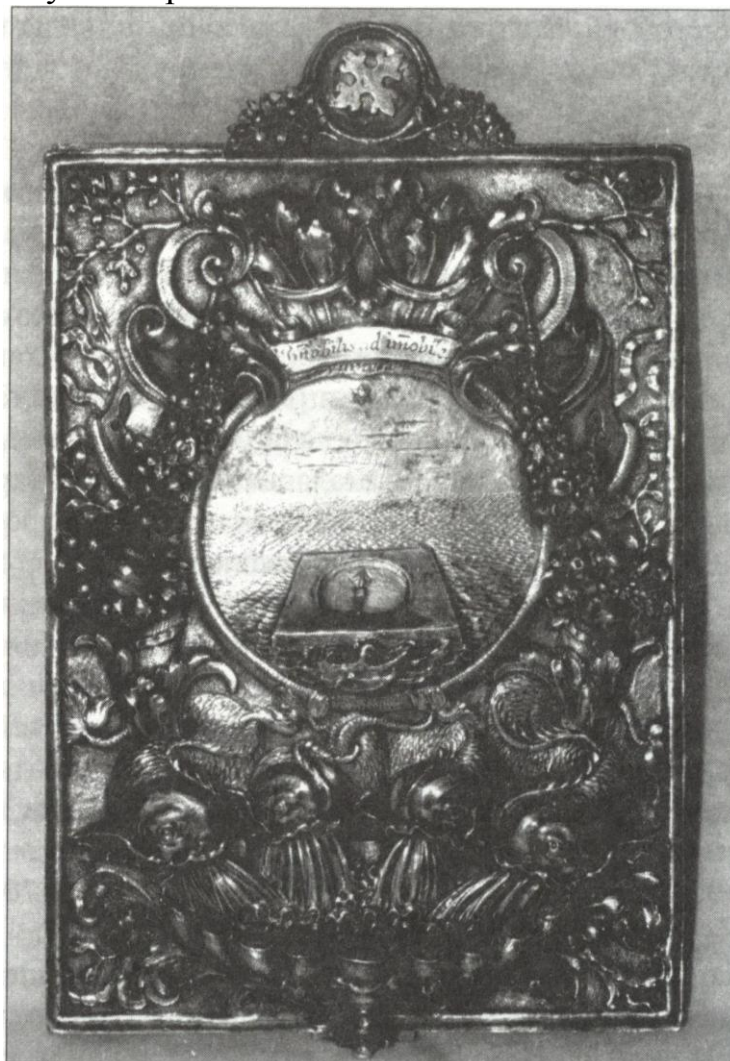
4. Записная книжка. 1691—1701. Мастер Иоганн Айслер. Музей земли Вюртемберг, Штутгарт

модернизировать в ней систему календарных шайб. Что касается экспоната из музея в Штутгарте, то речь идет в данном случае о записной книжке. Таблички для записей соединены друг с другом с помощью заклепки таким образом, что они могут поворачиваться.