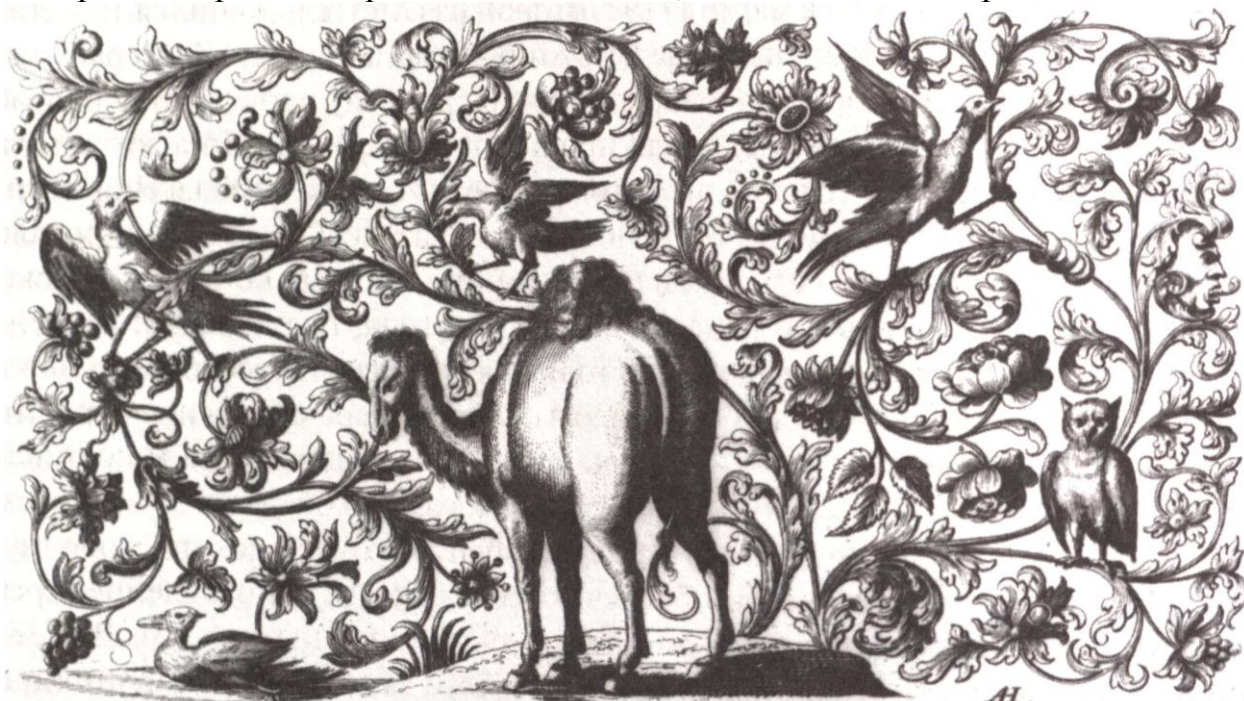
5. Абрахам Хельмхакк. Гравюра из альбома «Потребные для различных профессий орнаменты из побегов и листвы». Около 1700

Украшать свои календари Меттель начал около 1700 г., то есть на пике творческой деятельности. При этом орнаменты он строит симметрично, что отличается от пышного растительного декора оригинальных гравюр. Симметрия проявляется в трактовке стеблей листвы, скругленных по углам. Райские птицы между переплетающихся стеблей и цветущего аканта, которые можно найти на нюрн бергских календарях (см. ил. 3), также придают большую живость эскизам орнамента Абрахама Хельмхакка. Серебряные пластины, помимо этого, поделены ленточным орнаментом на сегменты. Он идет по краю внешней стороны, продолжается на вращающихся шайбах в центре и разделяет внутреннюю поверхность наподобие зубцов крепостной стены. Поэтому можно сказать, что Меттель не слепо копировал образцы Абрахама Хельмхакка, а самостоятельно развивал их.