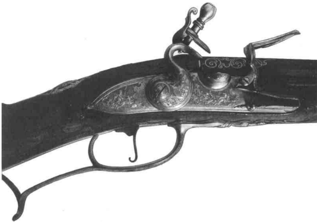
1. Ружье. Прага, мастер Пауль Позер. 1730-е гг 2J5