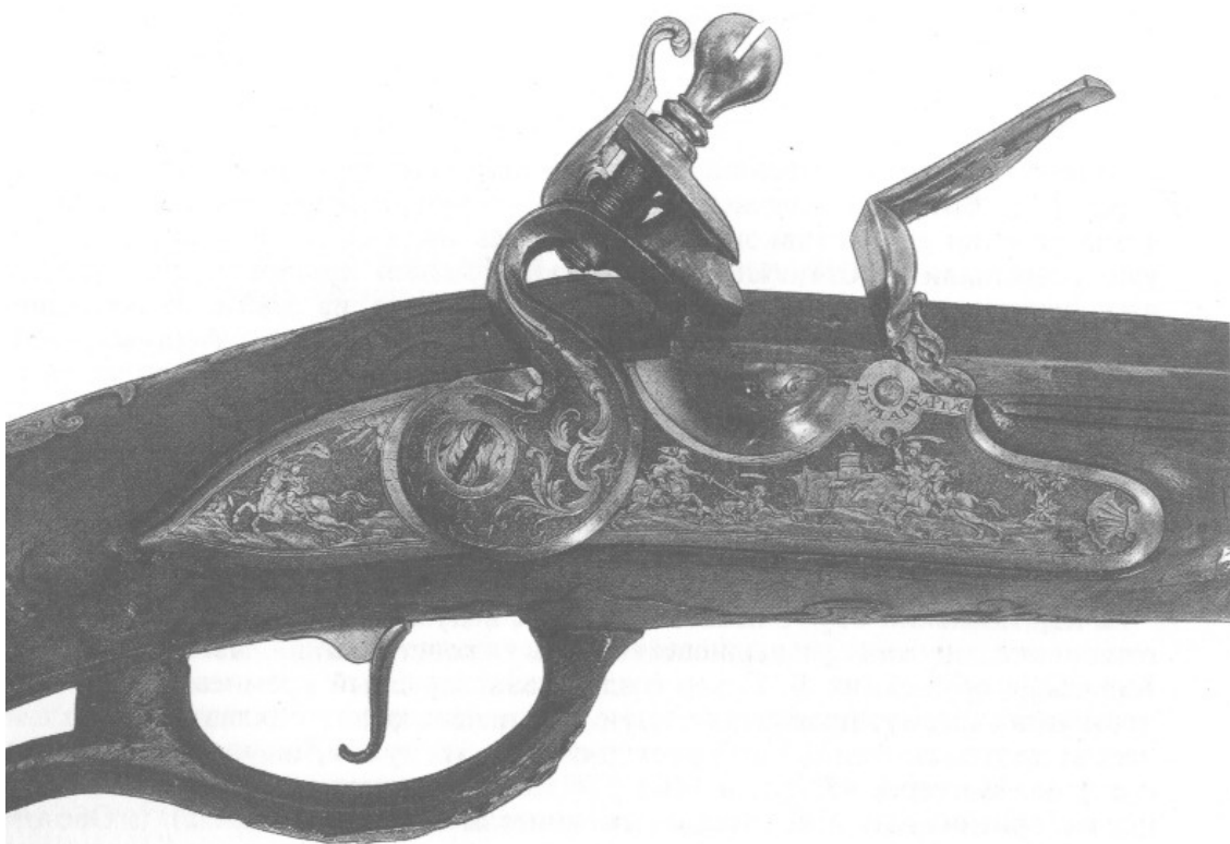
2. Ружье. Прага, мастер Иоганн Деплан. 1730–1740-е гг. Музеи Кремля. Деталь