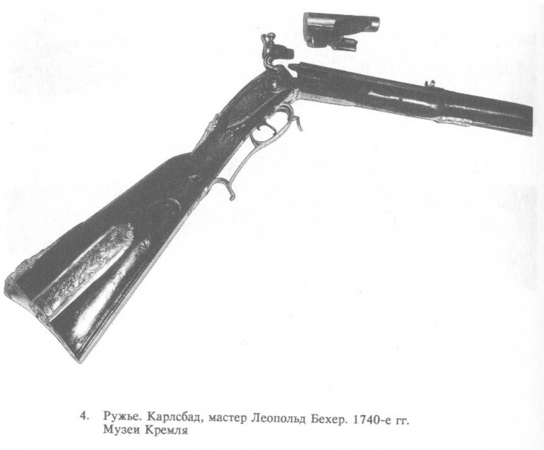
4. Ружье. Карлсбад, мастер Леопольд Бехер. 1740-е гг. Музей Кремля

Произведения мастеров из династии Петеров представлены в коллекции пятью ружьями. Они достаточно скромно оформлены, но отличаются большой прочностью и надежностью. В Оружейной палате хранятся два ружья, выполненные мастерами Ф.А. Петером и А. Шубертом в оружейных мастерских небольших чешских городов Лейтмеритце и Теплице. Эти предметы не имеют ярко выраженного авторского почерка и относятся к массовой оружейной продукции начала XVIII в.