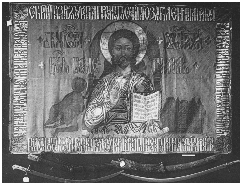
Ил. 4. Сабли К. Минина (слева, № 5924) и Д.М. Пожарского (справа № 5923). Фототип. Художник Панова. Опись Московской Оружейной палаты. Издано с высочайшего его императорского величества соизволения. Ч. IV. Кн. 3. Холодное оружие. М. 1885. Альбом рисунков к Описи Московской Оружейной палаты. [1884]. Табл. 323

ножках под черной кожей, но, к сожалению, ее оправа весом около полкилограмма ныне утрачена.