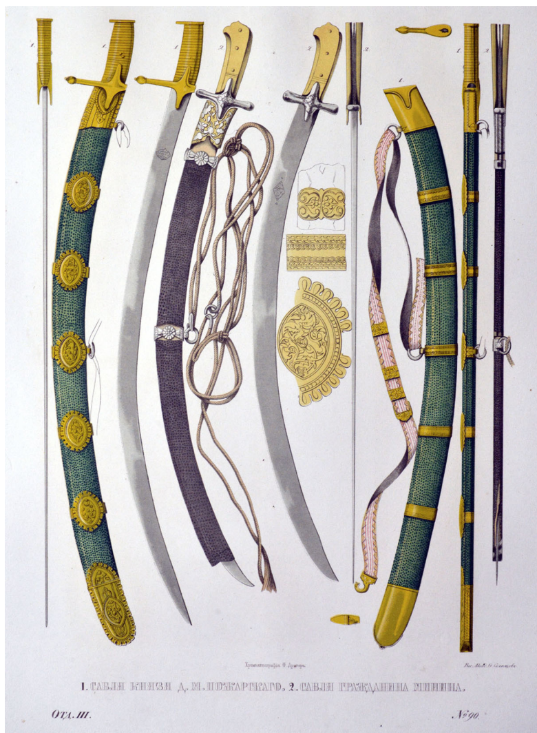
1. САБЛИ КНЯЗЯ Д. М. ПОЖАРСКОГО, 2. САБЛИ ПРАЗДАНИНА МИНИНА.