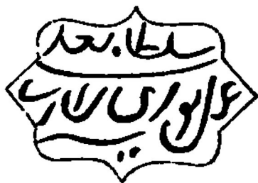
Ил. 7. Клеймо на сабле Д.М. Пожарского // Описание Московской Оружейной палаты. Издано с высочайшего его императорского величества соизволения. Ч. IV. Кн. 3. Холодное оружие. М., 1885. С. 183.

Клинок сабли Д.М. Пожарского также типичен для Иранского региона сефевидского периода, выполнен из булата, на первой трети правой стороны клинка нанесено клеймо, выполненное инкрустацией золотом в технике «зарнашин» (золотая проволока закрепляется в вырезанных в металле желобках (канавках) и шлифуется «заподлицо»). Клеймо выполнено в виде картуша «тыковка» с надписью «Султан Али, изделие Нури, сына Арисера», такой тип клейма характерен для шамширов, изготовленных в оружейных центрах Ирана в XVII в. (ил. 7).