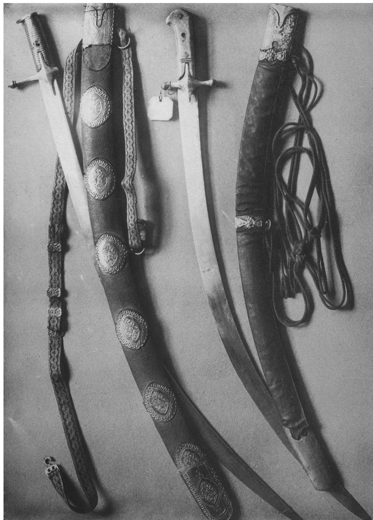
Ил. 3. Сабли Д.М. Пожарского (слева, № 5923) и К. Минина (справа, № 5924). Фототип. Художник Панова // Описание Московской Оружейной палаты. Издано с высочайшего его императорского величества соизволения. Ч. IV. Кн. 3. Холодное оружие. М., 1885. Альбом рисунков к Описи Московской Оружейной палаты. [1884]. Табл. 384