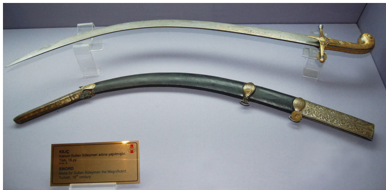
Ил. 2. Шамшир, середина XVI в. Стамбул. Музей армии.

В.Р. Новоселов одним из первых подверг сомнению принадлежность данных «реликвий» героям Смутного времени. Он указывает на ряд фактов, связанных с историей их передачи в Оружейную палату в 1830 г., акцентируя внимание на «сакральной» роли монастырских старожиллов в рождении данного предания 10 . В нескольких других публикациях также высказывались сомнения в их принадлежности, опирающиеся на новые данные 11 .