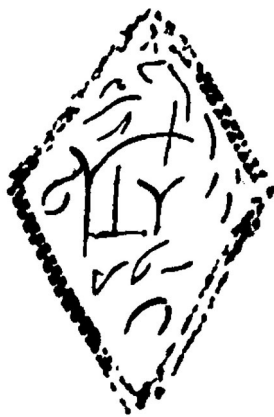
Ил. 5. Клеймо на сабле К. Минина // Описание Московской Оружейной палаты. Издано с высочайшего его императорского величества соизволения. Ч. IV. Кн. 3. Холодное оружие. М. 1885. С. 183

Накладки (щечки) рукояти выполнены из клыка моржа, на одной из накладок видны следы ремонта – распил, который, вероятно, связан с ремонтом или заменой крестовины. На них же имеются три параллельные полосы-желобка у места крепления крестовины, которые, возможно, улучшали функциональные свойства сабли, так как при ухвате эфеса создавали дополнительное препятс-