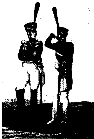
Штаб и обер-офицер гренадерских полков. 1813. Гравиора А.И. Килля.