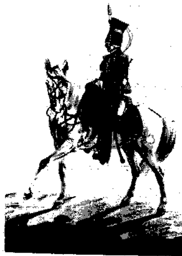
Штаб-фурьер Лейб-Гвардии уланского полка. 1817. Гравиора А.И. Килля.