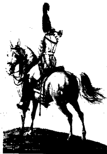
Штаб-фурьер Её величества Кирасирского полка. 1817. Гравиора А.И. Килля.