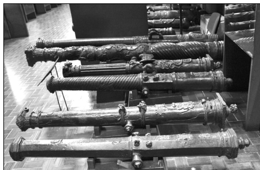
Рис. 4. Бронзовые пушки из Несвижского замка. Музей Польского Войска. Снизу вверх: «Сова», «Цирцея», «Попугай», «Гидра», «Химера»

На протяжении 1599–1600 гг. были изготовлены шесть пушек, которые сохранились до наших дней: «Гидра» (Hydra), «Цербер» (Cerberus), «Цирцея» (Circe), «Попугай» (Psittacus), «Виноград» (Vindemia) 24 и «Сова» (Noctua)