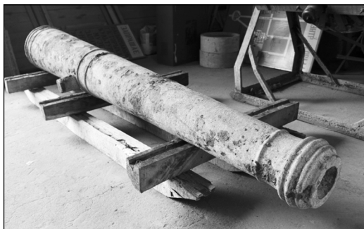
Рис. 5. Железная пушка, найденная в 2010 г.

не имея возможности расплавить, шведы просто утопили во рву замка вместе с другими трофеями. Впрочем, далеко увезти бронзовые орудия им не удалось. Не сумев переправиться через Припять, шведы были вынуждены утопить их неподалеку в речке Лахва. В 1717 г. 11 пушек и 2 мортиры, которые были найдены в Лахве, вернулись в Несвижский замок, в Стокгольм же попала только «Мелюзина», которую шведы забрали из бастионного замка в Ольке.