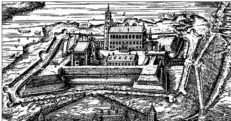
Рис. 1. Несвижский замок. Гравюра Т. Маковского, начало XVII в.

Х АРАКТЕРНОЙ особенностью Великого княжества Литовского, как и всей Речи Посполитой, была высокая роль частных крепостей в обороне страны. Это было связано в первую очередь с большими финансовыми возможностями, которыми обладали местные магнаты. Одной из наилучших крепостей такого рода был Несвижский бастионный замок, возведенный Николаем Христофором Радзивиллом по прозвищу Сиротка (1549–1616) в конце XVI в. (рис. 1, 2). Высокого мнения о замке были и шведы, которым он сдался в 1706 г.: «Крепость считается одной из лучших в Польше (Речи Посполитой. – Н. В. ). Защищенная четырьмя каменными бастионами и мощным контрэскарпом,