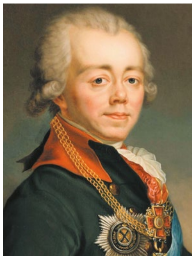
Ил. 1. Император Павел I

С конца XIX в. в отечественной историографии начинает складываться представление, что во время правления Павла I происходит «опруссачивание» русской армии, когда гатчинские «спешные порядки», внедренные новым императором, привели к тому, что русские войска резко потеряли в боеспособности