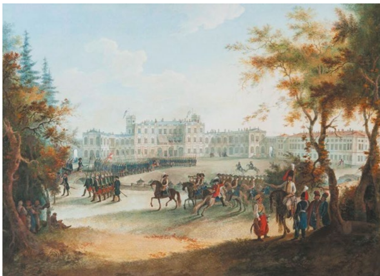
Ил. 2. Вахтпарад в Гатчине

приемам обращения с оружием, разным маршам, разводному параду и так далее 26 . При этом император лично следил, чтобы из полков присылали офицеров и солдат «ревностных и радеющих».