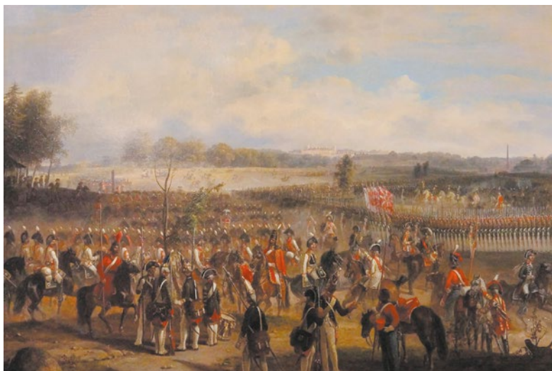
Ил. 3. Г. Шварц. Маневры в Гатчине при Павле I

в месяц, и зачастую на них присутствовал император с сыновьями 30 (ил. 2).