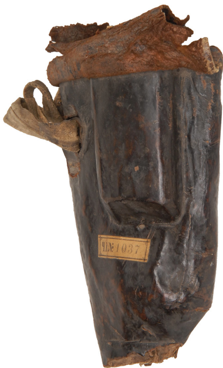
Ил. 1. Ольстра пистолетная. Швеция. Начало XVIII в.

Ольстра (ил. 1) повторно была принята на учет в 1990 г. как ошибочно списанный предмет из довоенных коллекций Новгородского музея. Сейчас выявлено, что «ольстреда пистолетная от шведского седла из черной кожи времен Петра I. 1709 г.» передана в 1948 г. из Артиллерийского музея вместе с образцами военной формы времени Петра I: мундиром лейб-гвардии Семеновского полка, камзолом солдатским и панталонами темно-зеленого сукна 14 . На предмете наклейка с напечатанным номером: «Ч. I. № 1037» 15 . На фрагменте пришитой бирки надпись фиолетовыми чернилами: «А.И.М.». В ольстру вложена бирка с печатными изображениями двуглавого орла, медальона с латинской надписью: «HISTUTAPERENNAT» («Здесь в безопасности пребывает»), надписями: «ОТДѢЛЬ», «Названіе предмета» и простым карандашом — «АИМ 14.