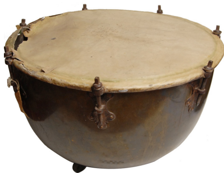
Ил. 2. Литавра. Россия. XVIII в.

Литавра (ил. 2) с латунным корпусом — котлом с резонаторным отверстием в дне, с железным кованым треножником на трех ножках-шариках, приклепанных шестью медными заклепками к корпусу. Кожаная мембрана светлая. Семь крепежных винтов ввинчены в железные декорированные гайки, приклепанные к корпусу медными заклепками.