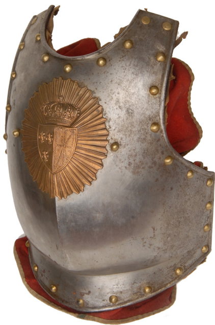
Ил. 4. Нагрудная часть кирасы кирасирских полков королевской гвардии. Франция. 1815–1825 гг.

В 1960 г. переданы 8 единиц огнестрельного оружия: винтовка системы Мосина обр. 1891–1930 гг. русская модернизированная, 1937 г. (на металлической накладке надпись: «Применялась советскими войсками Ленинградского фронта в 1941–1945 гг.»); винтовка системы Мосина обр. 1891 г. русская, Тула, 1921 г. (на казенной части выбито: «Первые Тульские оружейные заводы РСФСР 1921 г.»). Поступила в АИМ в 1955 г. из военной базы № 214); карабин системы «Маузер» обр. 1898 г., Германия (из трофеев Ленинградского фронта); карабин Арисака обр. 1908 г., Япония, 1910–