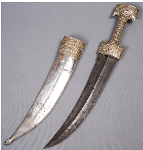
Ил. 8. Кинжал и ножны. Турция. XVIII в.

Ствол ружейный турецкий XVIII в. из дамаска, круглый в дульной и средней части, в казенной части восьмигранный, декорирован аркой и плетенкой золоченой насечки, с клеймом мастера.