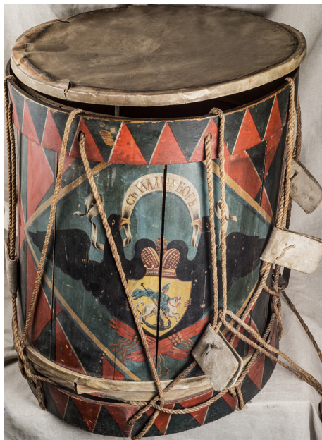
Ил. 3. Барабан. Россия. Конец XVIII — начало XIX в.

бечевки. Корпус набран из 18 клепок, затонирован в красный и черный цвет: геометрический орнамент из треугольников. Петля для подвески инструмента к ремню барабанщика латунная. С наружной стороны нижней мембраны укреплены четыре кишечные струны. Пары бечевки охватены кожаными манжетами, затонированными в белый цвет. На корпусе изображение двух черных орлов, держащих в клювах белую ленту с надписью: «СЪ НАМИ БОГЪ». Между орлами под короной изображение герба Москвы, по ним — стили-