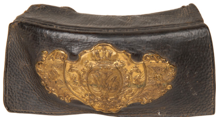
Ил. 11. Подсумок кавалерийских полков. Россия. 1730–1741 гг. Передан из Артиллерийского музея в музей поселка Любытино, а после его закрытия в Новгородский музей в 1954 г.

Стоит отметить также «Правила строевой пешей артиллерийской службы» 27 и книгу из собрания Новгородского музея до 1941 г. «Мемории или Записки артиллерийские» 28 .