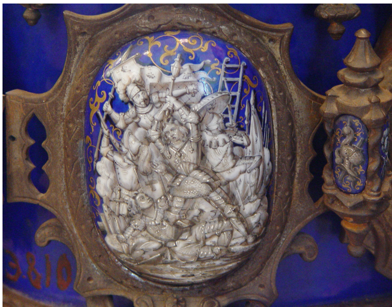
Ил. 7. Медальон корпуса часов «Схватка рыцарей». Франция. Фирма Le Roy & Fils. 1-я треть XIX в.

В 1946 г. из Артиллерийского музея переданы шесть предметов: два эспонтона, два кремневых турецких ружья XVIII в., русский штык к пехотному ружью обр. 1828 г. (укороченный) и ружейный ствол.