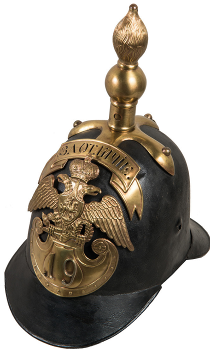
Ил. 5. Каска. Россия. 2-я четверть XIX в.

Часы настольные в овальном синем керамическом корпусе и стальном каркасе. Сверху на корпусе композиция: бой четырех пеших рыцарей и двух — на конях. В центре на вздыбленном коне рыцарь. У ног лошади другой, поверженный конь. Каркас часов декорирован французскими лилиями и овальными эмалевыми медальонами — на двух изображения гризайлью по синему фону сражений рыцарей, военных атрибутов, барабанов, знамен и штурмовых лестниц (ил. 7), на двух медальонах сбоку и на деталях каркаса изображена арматура. Круглый циферблат с золотыми римскими цифрами и надписью скорописью. Указана фирма и длительность завода: «Le Roy & Fils 9 ric Mont pensier Pis Roy a la Paris». На задней крышке часового механизма выбито название фирмы-производителя, серийный номер и золотая медаль: