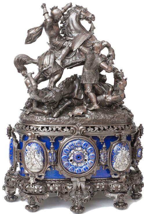
Ил. 6. Часы «Схватка рыцарей». Франция. Фирма LeRoy&Fils. 1-я треть XIX в.

«LE ROY & FILS № 4449 A PARIS», «MEDALLE D'OR 1827 Jons». Над медалью процарапана дата реставрации часов: 19 марта 1916 г. и буквы: «19 19/III 16 AK».