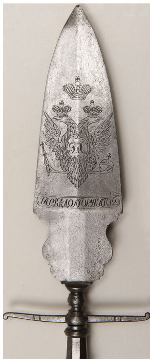
Ил. 9. Эспонтон. Россия. XVIII в.

Эспонтоны с наконечником в виде широкого пера с фигурным основанием, граненой крестовины, конической граненой трубки с тремя фризами и двумя пожилинами. Концы крестовины загнуты в разные стороны — вверх и вниз 23 . На наконечнике с обеих сторон гравированные российские гербы под коронами с вензелями императоров и надписи; у одного эспонтона — «П I», надписи: «ГАРК Я/Н ДОЛГОРУКОГО 20/2» (ил. 9), «ПОЛКУ». На пере второго с обеих сторон — «А I» и «Л:М:П».