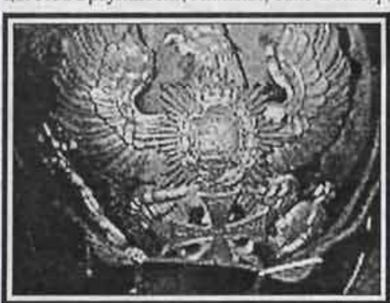
Налобная бляха войск герцогства Закс-Веймар-Айзенах с крестом (для резервистов)

Оставшуюся часть армии составляли герцогства Брауншвейг, Анхальт, Закс-Веймар,