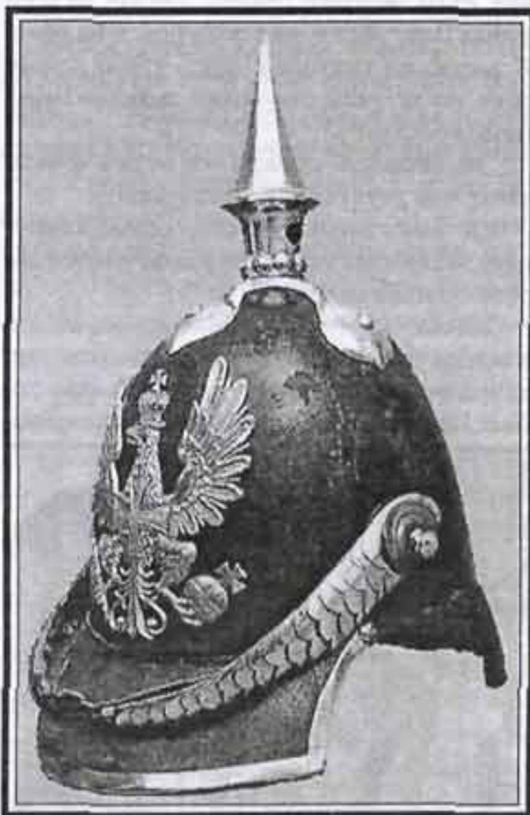
Каска рядового прусской пехоты, модель 1842 г.

Несмотря на свою кажущуюся непрактичность, к концу XIX в. каска, известная под названием "шишака" нашла свой путь практически во все армии Европы. Попробуем же проследить основные пути ее развития в Пруссии.