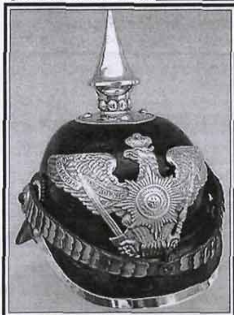
Модель 1871 г. Железнодорожный полк (Пруссия)

мой было объявлено крепление налобной бляхи и подбородочных чешуек. В итоге, полоска на затылочной части каски была восстановлена, а металлическая фурнитура крепилась теперь на болты с гайками.