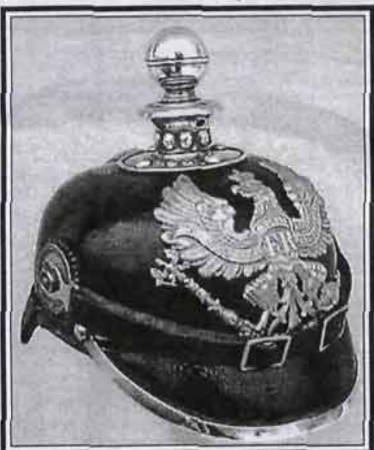
Модель 1891 г. Прусская пешая артиллерия

В 1895 г., за счет добавления двух отверстий в шпиль, была улучшена вентиляция каски. Изменился и способ крепления налоб-