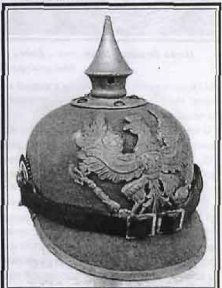
Модель 1915 г. Полевой (временный) пехотный полк