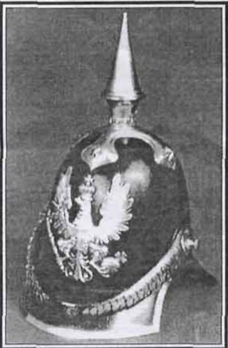
Каска офицера резервного полка, модель 1842 г.

Даже не очень разбирающийся в униформологии человек, увидев в музейной витрине или на картинке такую каску, сразу заявит: "А-а... Это немецкая штука". И действительно, к 1918 г. все германские государства и многие иные страны, включая Соединенные Штаты и Англию, надели такие каски на своих солдат. В некоторых странах Южной Америки, например – в Чили, их