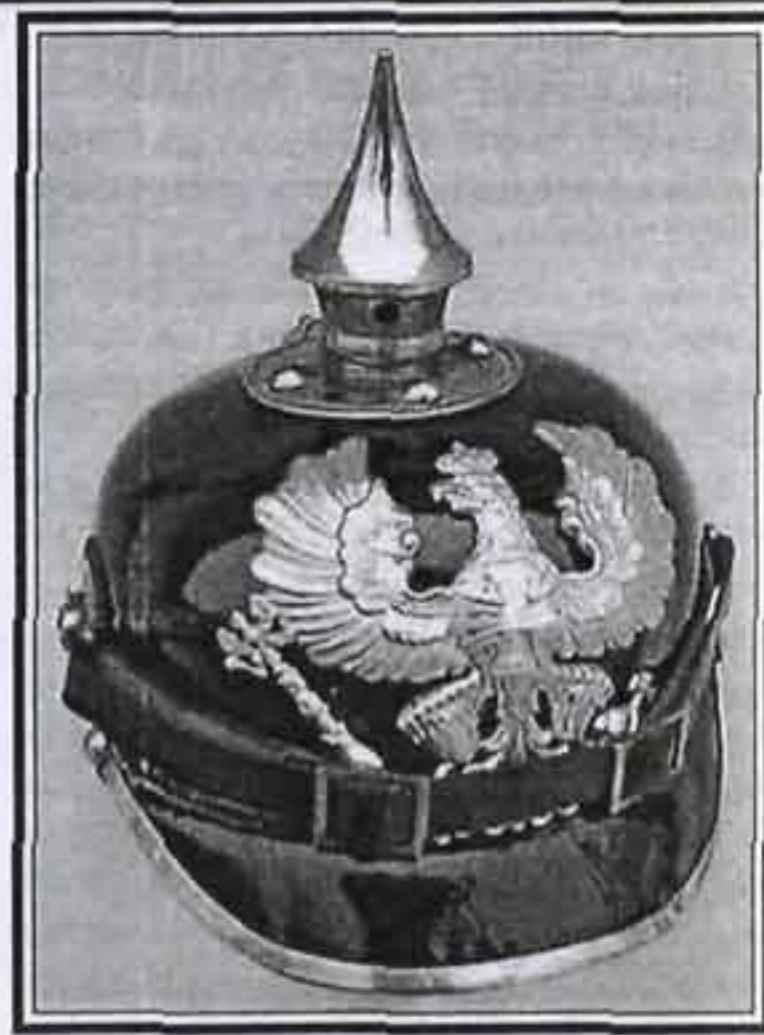
Модель 1895 г. 31-й прусский резервный пехотный полк

Подбородочные чешуйки - Schuppenkette Каска - Helmkopf Налобная бляха - Helmwappen, Helmzier, Zierrat, Wappen, Emblem Кокарда - Kokarde