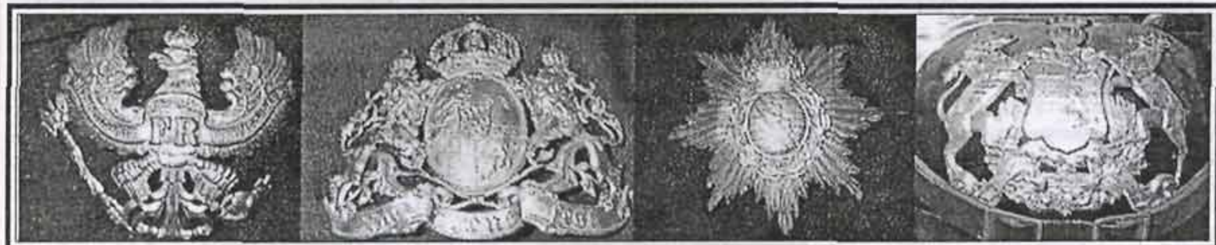
90,9% всей германской армии составляли войска Пруссии (70,7%), Баварии (9,6%), Саксонии (7%) и Вюртемберга (3,6%)