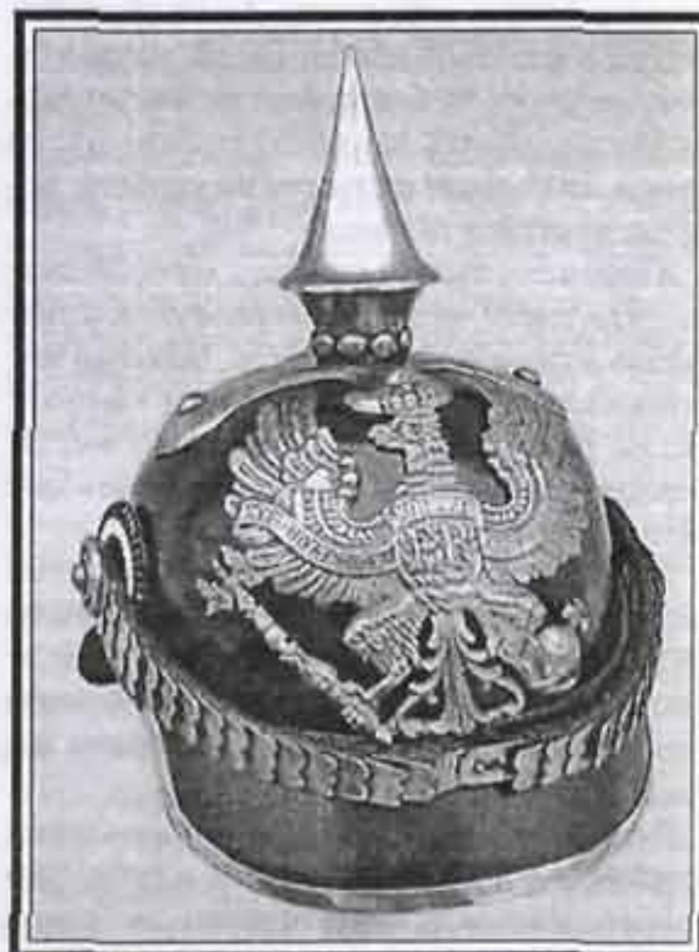
Модель 1860 г. 79-й ганноверский пехотный полк

Все металлические детали были выполнены из латуни, а у офицеров – из позолоченной бронзы. У гвардейских полков и обозных частей – из белого металла. Навершием каски служил шпиль, в нижней, цилиндрической части которого – над украшением, называвшемся "Perling" (дословно – "жемчужное кольцо") – находились два вентиляционных отверстия. Крепился шпиль на крестообразной пластине с помощью заклепок (в виде звездочек у офицеров и круглых – у рядовых). На лобовой части в армейских полках крепился большой геральдический прусский орел с короной, скипетром и державой, в гвардейских же полках орел держал в лапах скипетр и меч, а кры-