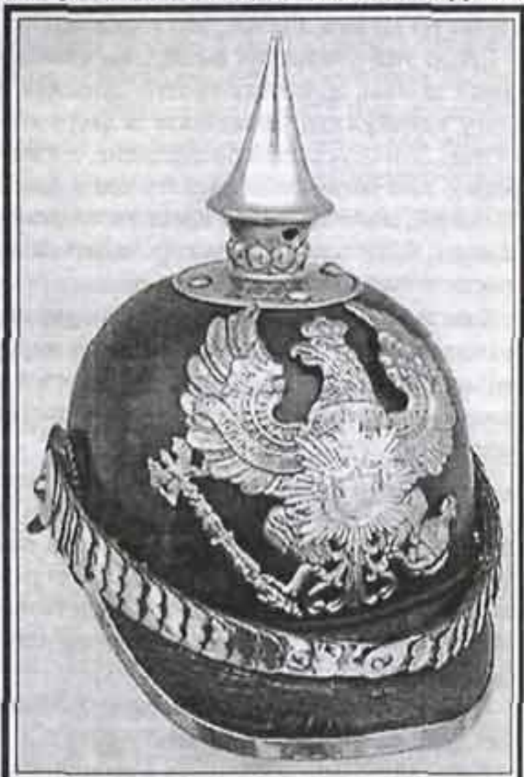
Модель 1867 г. 91-й пехотный полк Ольденбурга

Кокарду носили на правой стороне, под креплением подбородочной чешуи. Кокарда представляла собой кожаный кружок,