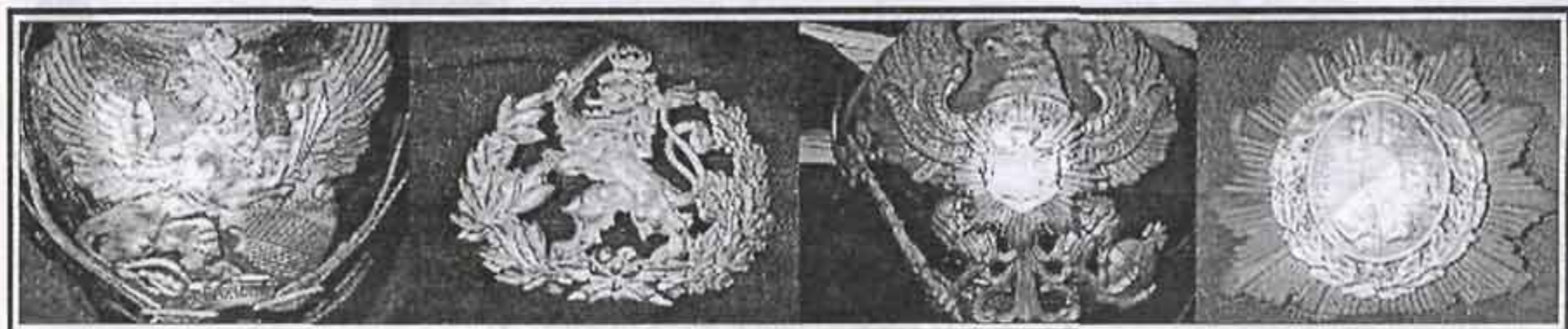
Пять Великих герцогств – Баден (3,6%), Гессен-Дармштадт (1,9%), Ольденбург (0,4%), Мекленбург-Шверин (0,8%) и Мекленбург-Штрелиц (0,1) (нет картинки) добавляли армии еще 6,7%.

1842 г. меньшими. Уменьшился и задний козырек. Но все остальные детали фурнитуры остались без изменения.