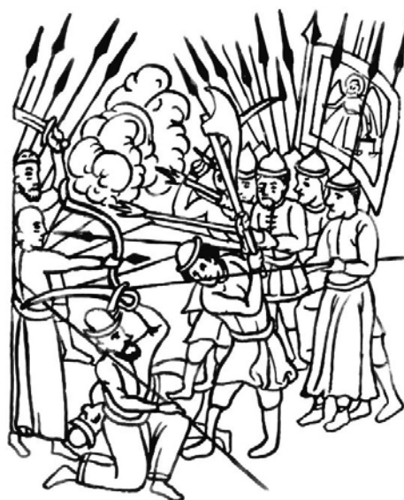
Рис. 2. Бой между татарскими и русскими воинами на р. Тагиле.