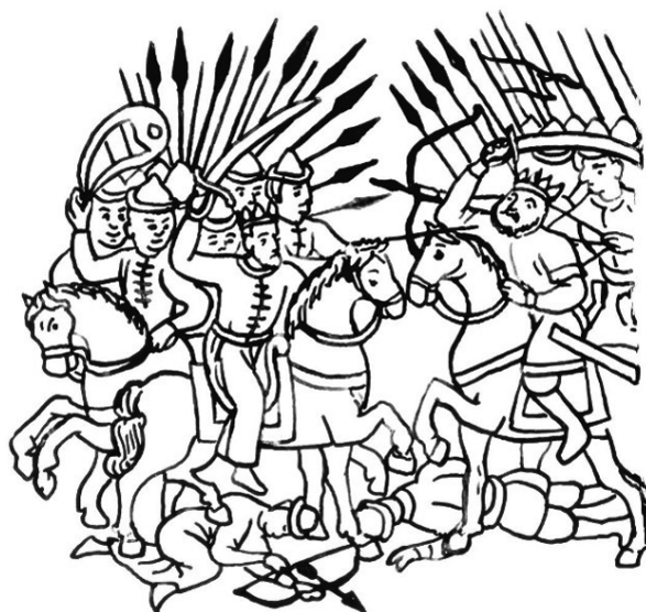
Рис. 1. Бой между отрядами татарских воинов под Кашлыком.

Три эпизода боевых столкновений воспроизведены на рисунке, передающем поход отряда Ермака по р. Туре. Татарские воины показаны в высоких малахаях с широкими полями, или без головных уборов с обритыми головами, в кафтанах и длиннополых зипунах. В руках у них изображены копьё с удлинненно-ромбическими наконечниками, луки и стрелы, сабли. Над головами воинов воспроизведена праща и знамя на длинном древке с удлинненно-ромбическим наконечником и двумя длинными косицами. К поясу подвешены сабли в ножнах, налучье и колчан со стрелами. На переднем плане показаны убитые и раненые с копьем, луком и стрелой. Российские воины, принимающие участие в этом бою, изображены в европейских сферических шлемах и латах, стреляющими из пищалей, с копьями, бердышами, саблями в руках. В одном эпизоде над головами воинов воспроизведены знамена с изображением святого [Миллер, 1999, рис.13].