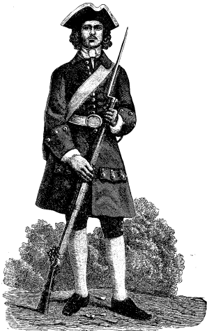
Одежда и вооружение потѣшныхъ.