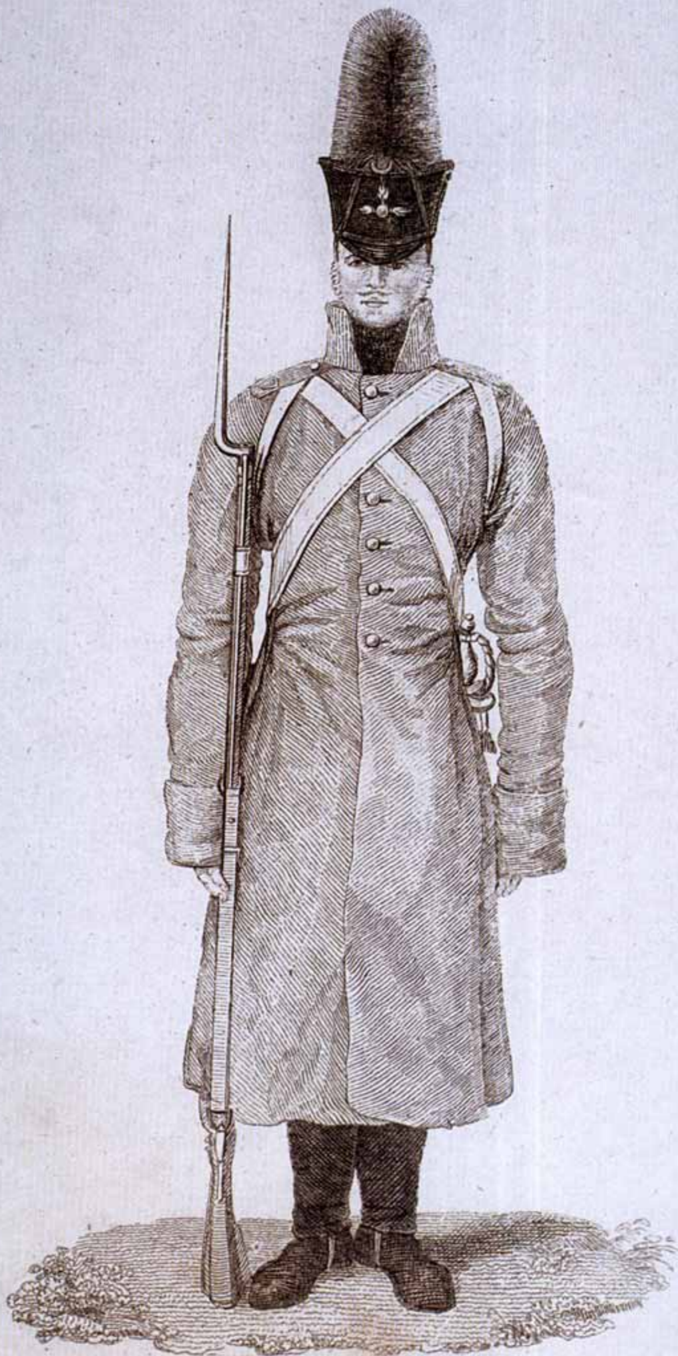
Видъ Солдата съпереди въ шинели, шлюющего ранецъ по новой формѣ.