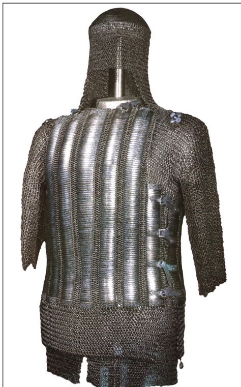
Рис. 3. Бахтерец царя Михаила Федоровича. 1620 г. Мастер – Конон Михайлов. (4564 ОП). Длина – 66 см, ширина – 55 см, вес – 12 300 г. Диаметр колец – 12 мм, всего колец – 9000. Общее количество пластин – 1509

Учитывая общегосударственное значение столичного центра ору-