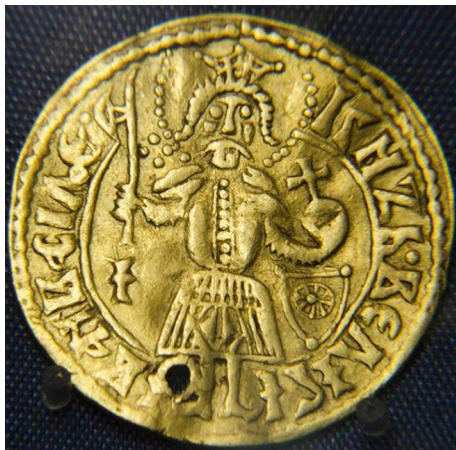
Илл. 2. Золотой «угорский» дукат великого князя Ивана III и его сына-соправителя Ивана Молодого (ГЭ. ОН-Р-Аз-19. диаметр 2,4 см, вес 3,59 г. 958 проба)

среди парадного оружия XV–XVI вв. у дворцовой стражи европейских правителей, в частности, императора Священной Римской империи Максимилиана I.