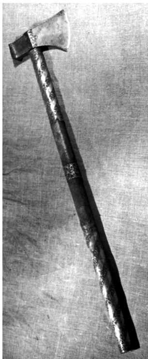
Ил. 4. Парадный топор с золотой наводкой (5515 ОП)