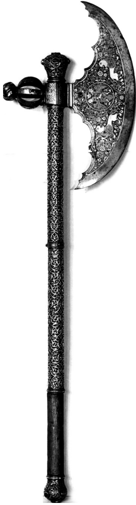
Ил. 6. Парадный топор с насеченными золотом двуглавыми орлами под тремя коронами (5533 ОП; ОР-2238). Длина с древком – 99,0 см, длина топора – 38,0 см, ширина топора с обухом – 29,5 см

орлы, как отмечено в описи 1687 г. под № 2: «два топора Турские, булат красной, каймы и обухи наведены золотом на обе стороны; под обухи мишени и под мишеньми по клейму, в клеймах по орлику с коруны на обе ж стороны наведены золотом; среди топоров репы прорезаны; топорница худы серебряны белые, по два наконешника, да по две обоймицы чеканные золочены. А по нынешней переписи рч'е года и по осмотру, те топоры против прежних переписных книг сошлись. Цена тем топорам по сту по десяти рублей за топор». 58