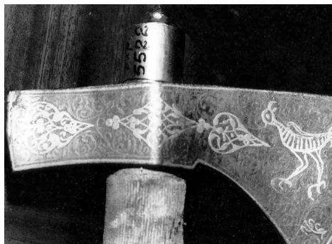
Ил. 5. Парадный топор с серебряной декоративной насечкой и насеченным золотом двуглавым орлом под одним венцом с одной стороны и птицей с другой (5522 ОП). Длина с древком – 68,7 см

Рынды на гравюре И.Т. де Бри изображены без золотых цепей крест-накрест, о чем свидетельствует текст Я. Ульфелдта, но самое главное, они представлены с топорами не в положении «на плечо», а изготовленными для удара. Кроме того, парадные топоры рынд изображены двух типов, причем топоры у пары рынд, что по левую руку от царя, имеет характерную сужающуюся форму (ил. 3). Во время аудиенции английского посла в России