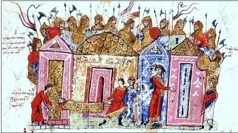
Ил. 1. Варяжская стража императора Льва V. Миниатюра. Хроника Иоанна Скилицы. XII в. Madrid, Biblioteca Nacional. MS Graecus. Vitr. 26-2. fol. 26va

На византийское происхождение чина рынд указали одними из первых российские историки Ф.И. Миллер 8 и Н.И. Новиков 9 , сославшись на историческое сочинение середины XII в. «царевны Анны Комниновой», т. е. на «Алексиаду» (Αλεξιάδα), в котором действительно упоминаются варяги (ил. 1) в качестве почетного