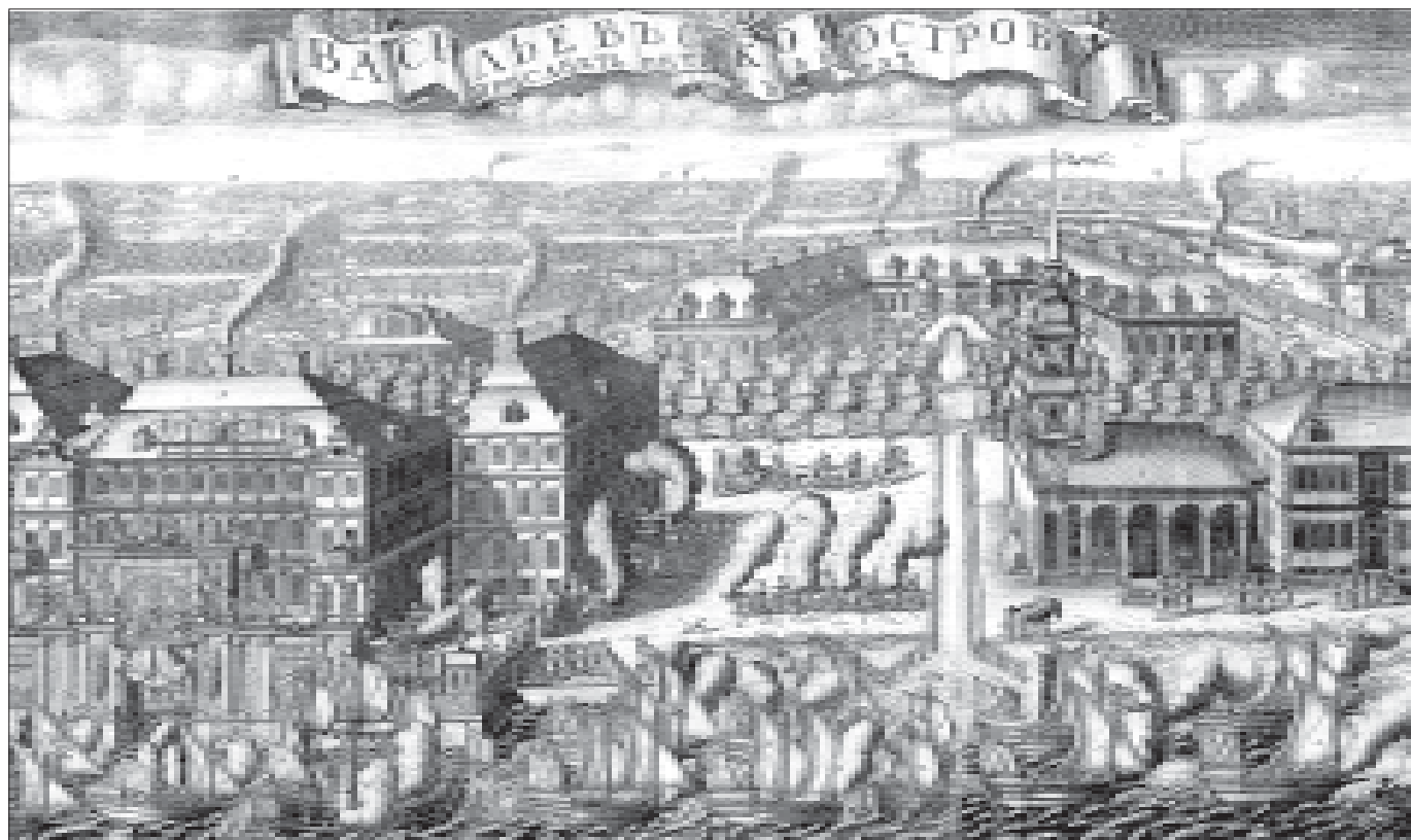
Рис. 3. А.Ф. Зубов. Триумфальный ввод шведских судов в Петербург 9 сентября 1714 года после победы при Гангуте. 1714 г.