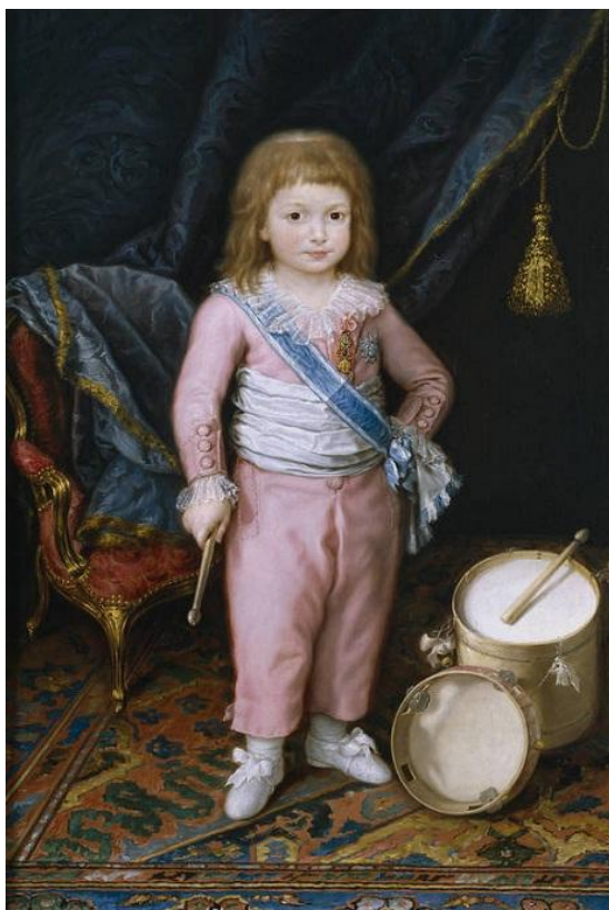
Infante by Carnicero

Длинные брюки у мальчиков - это смелое новшество — ведь в то время их носили только моряки и рабочие, в то время как дворянство и буржуазия ходили в бриджах.