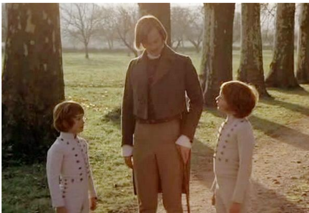
Случайно наткнулась на фильм "Дуэлянты" и там детишки бегали в таких скелетончиках.

Диккенс писал в "Раздумьях на Монмут-стрит": "Первым с краю висел много раз чиненный, порядком измазанный костюм "скелетик" – узкий футляр из синего сукна, в какие засовывали маленьких мальчиков до того, как вошли в обиход свободные платьица