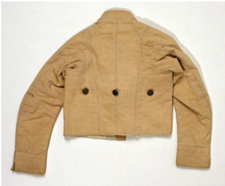
Suit (Skeleton Suit) ca. 1795–1805 Музей Метрополитен