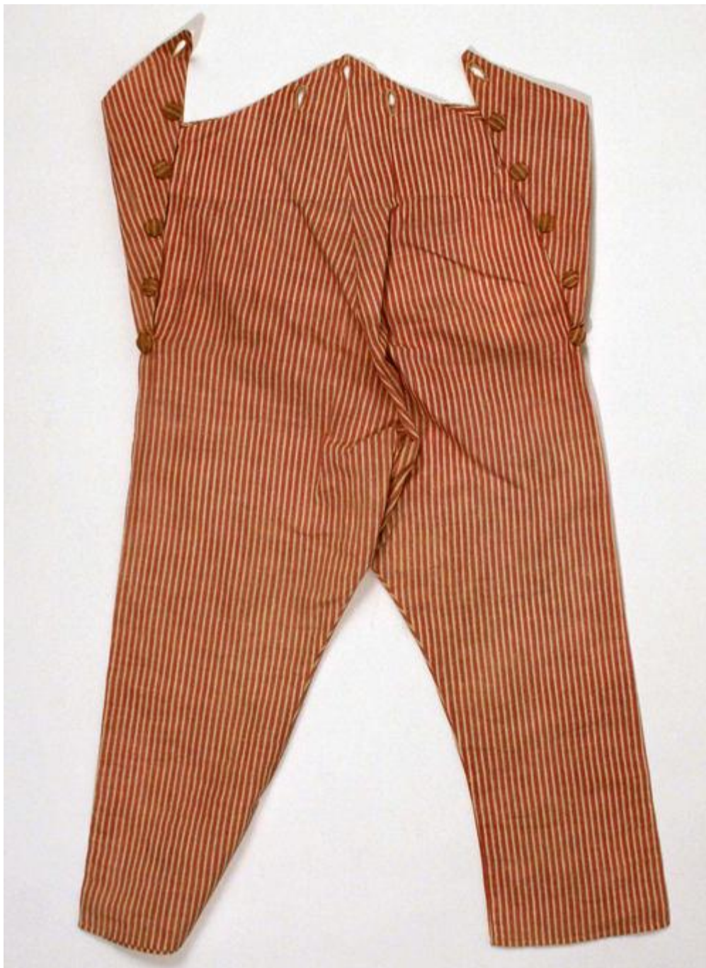
Suit (Skeleton Suit) 1820 Музей Метрополитен

Синий был любимым цветом, но бывали костюмчики горохового, алого или горчичного цвета.