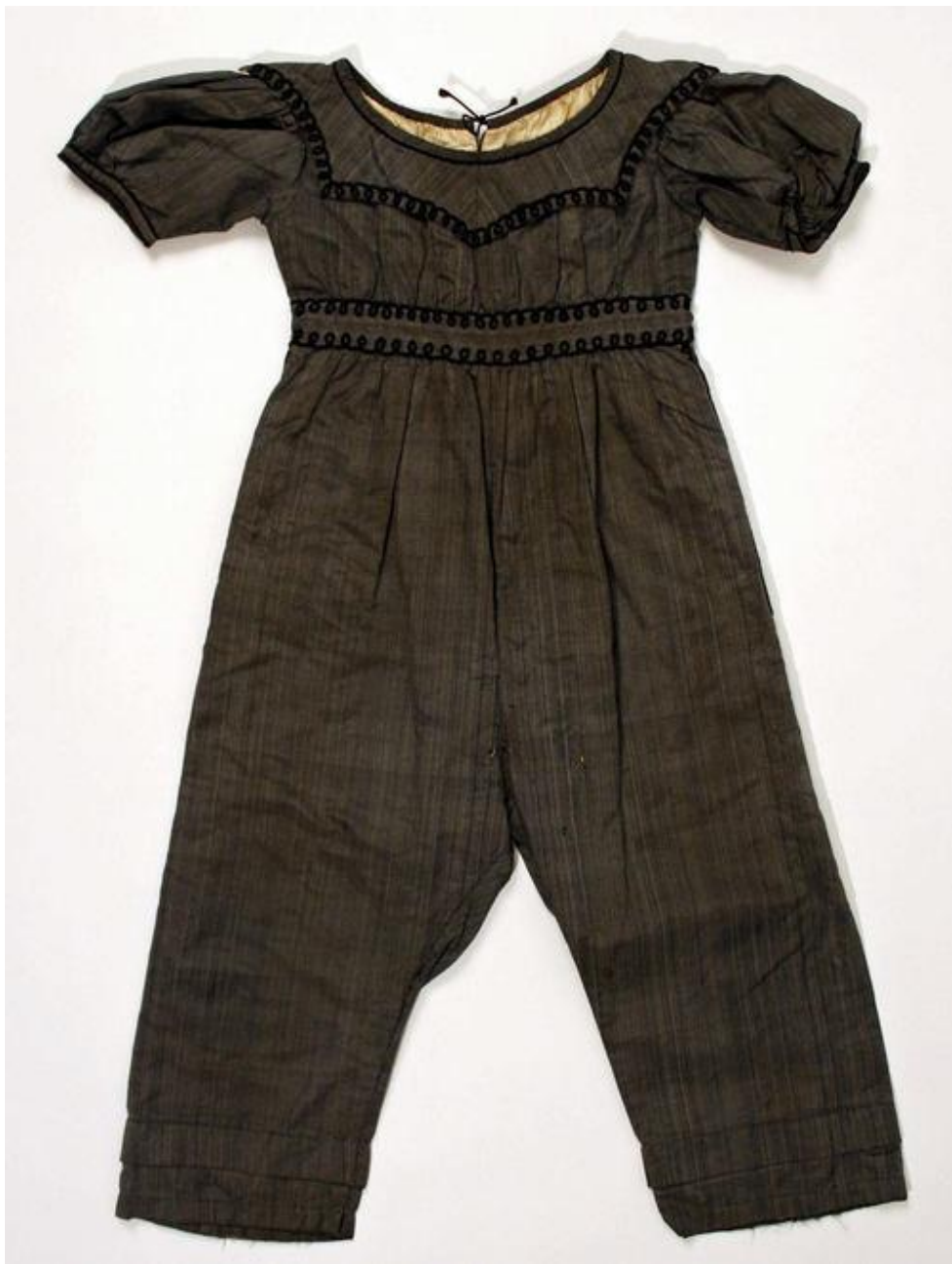
Suit (Skeleton Suit) 1830–39 Музей Метрополитен