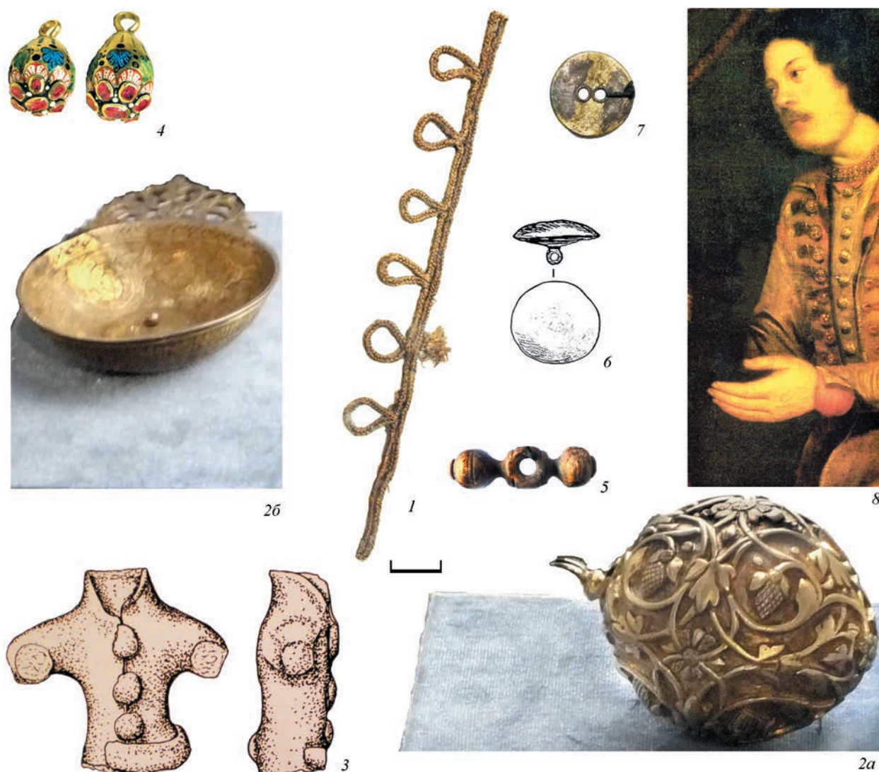
Рис. 5. Контрасты петель и пуговиц XVII в.

1 – фр-т застежки из воздушных петель из погребения, материалы Д. Я. Самоквасова (ГИМ, № 76990, оп. 1011/127); 2 – пуговица из экспозиции Громовой башни Смоленского кремля (МВИ РВИО); 3 – керамическая фигурка XVI в. (Жилина, 2015. Рис. 13, 3); 4 – сфероконическая пуговица из собрания ГОП; Москва, археологический материал – 5 – Моисеевский мон-рь; 6 – грибовидная пуговица, Климентовский пер.; 7 – Манежная пл.; 8 – фр-т группового портрета участников русского посольства в Англию 1662 г. ГРМ (Русские ювелирные... 1987. С. 33).