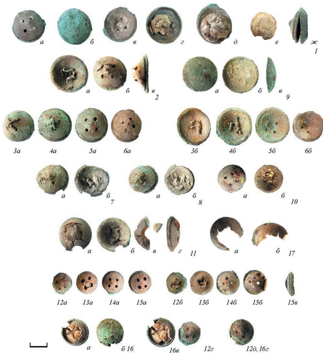
Рис. 4. Серия пуговиц из раскопок Богоявленского монастыря в Москве (МОММ, № 28392/48, 49, 50).

мыкавшая к ткани, состоит из двух плотно соединенных слоев, внутреннего металлического и наружного, вторящего ему, слоя из папье-маше (рис. 4, 1а, 1в, 2). В этой части проделаны четыре отверстия для пришивания. В отверстиях сохранились расположенные крест-накрест нитки, которыми пуговицы были пришиты (рис. 4, 3–10, 12–15). Металлическая часть пуговицы, выступавшая из петли одежды, име-