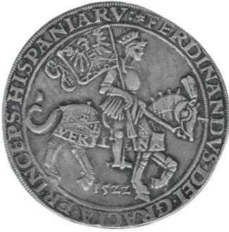
Ил. 3. Гульдинер Фердинанда I. 1522. Лицевая сторона. Государственный Эрмитаж