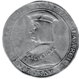
Ил. 4. «Цвиттергульдинер» Фердинанда. 1522. Оборотная сторона. Государственный Эрмитаж

с рассматриваемым нами гульдинером Максимилиана I, а «цвиттергульдинер» представляет собой еще и интересный нумизматический «куръез». Говоря об изображении на монете Фердинанда I, нет полной уверенности, что имеет место отображение реально существовавшего доспеха, а не подражание презентационной монете прославленного деда, настолько совпадают подробности обоих памятников. Основное различие состоит только в проработке лица под поднятым забралом, более скромной эрцгерцогской короне над шлемом Фердинанда и другом девизе по краю конских лат.