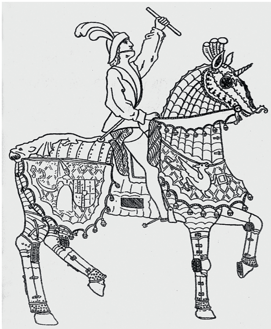
Ил. 5. Конский доспех «готического» образца. Прорисовка К. М. Чернышова