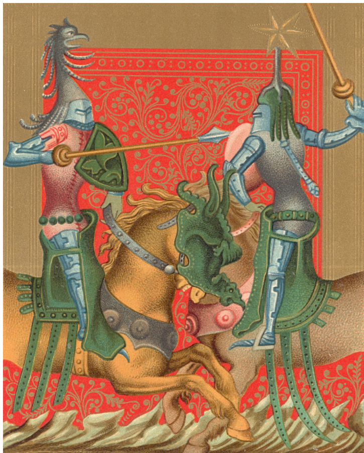
Ил. 2. Миниатюра со сценой турнира. Из кн.: Schulz A. Deutsches Leben im XIV–XV Jrh. Wien, 1892. Государственный Эрмитаж

и изобразительные аналогии позволяют уверенно утверждать, что в данном случае имелось в виду стилизованное гротескное изображение дракона. Наиболее раннее изображение такого шаффрона имеется в сцене турнира на миниатюре германской иллюминированной рукописи 1387 года, что позволяет проследить истоки данной позднесредневековой придворной традиции 16 (ил. 2). Имеется также целый ряд подобных изображений вплоть до XVI века, лучшим из которых можно признать гравюру венецианского мастера Якоппо Беллини 1440–1450 гг.