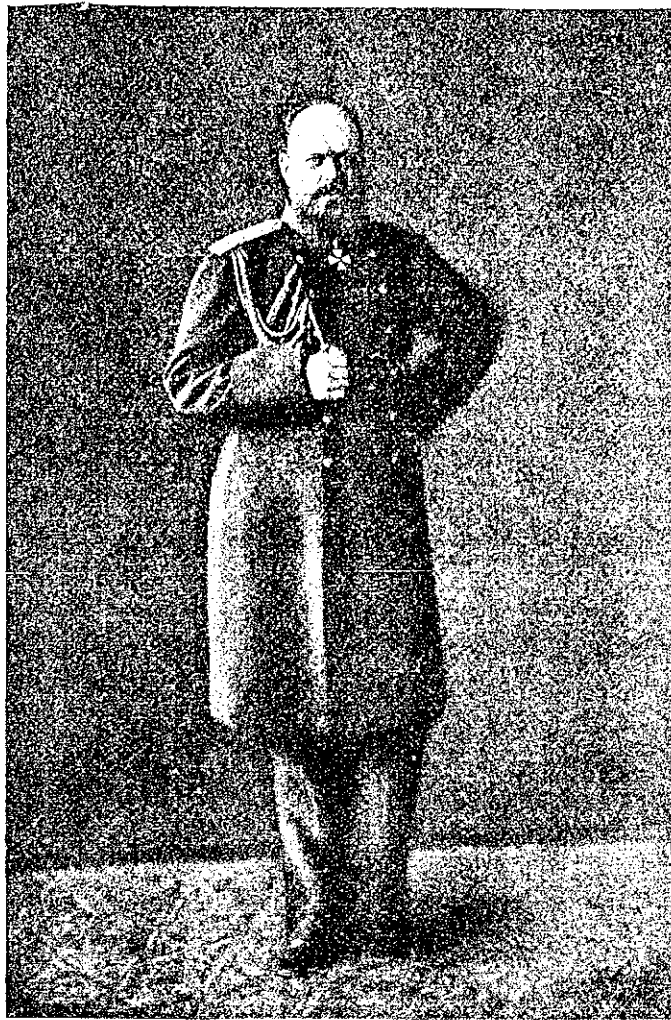
Императоръ Александръ III Шефъ полка съ 26 февраля 1874 года.