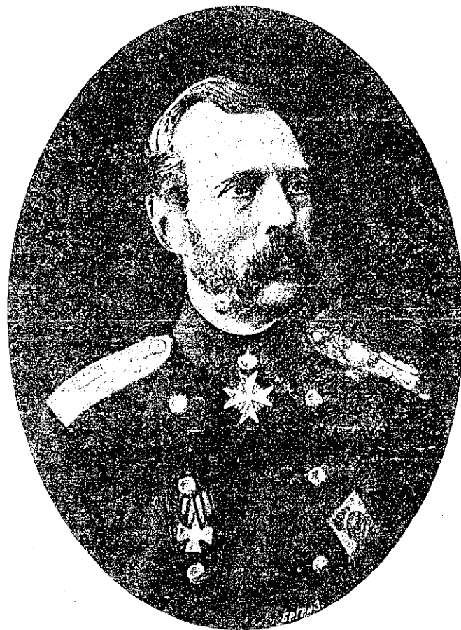
Императоръ Александръ II Шефъ полка съ 26 августа 1839 года.