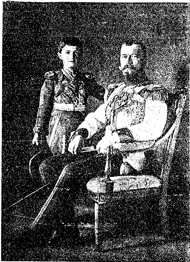
Его Императорское Величество Государь Императоръ Николай Александровичъ и Его Императорское Высочество Наслѣдникъ Цесаревичъ Алексѣй Николаевичъ.