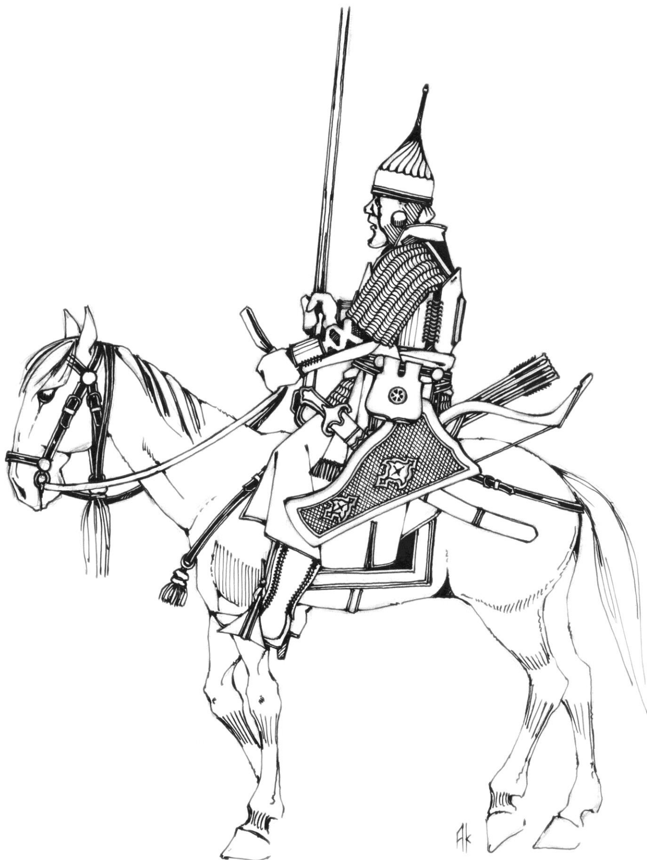
Дворовый сын боярский в зеркале, на коне простом, 1570-е гг.