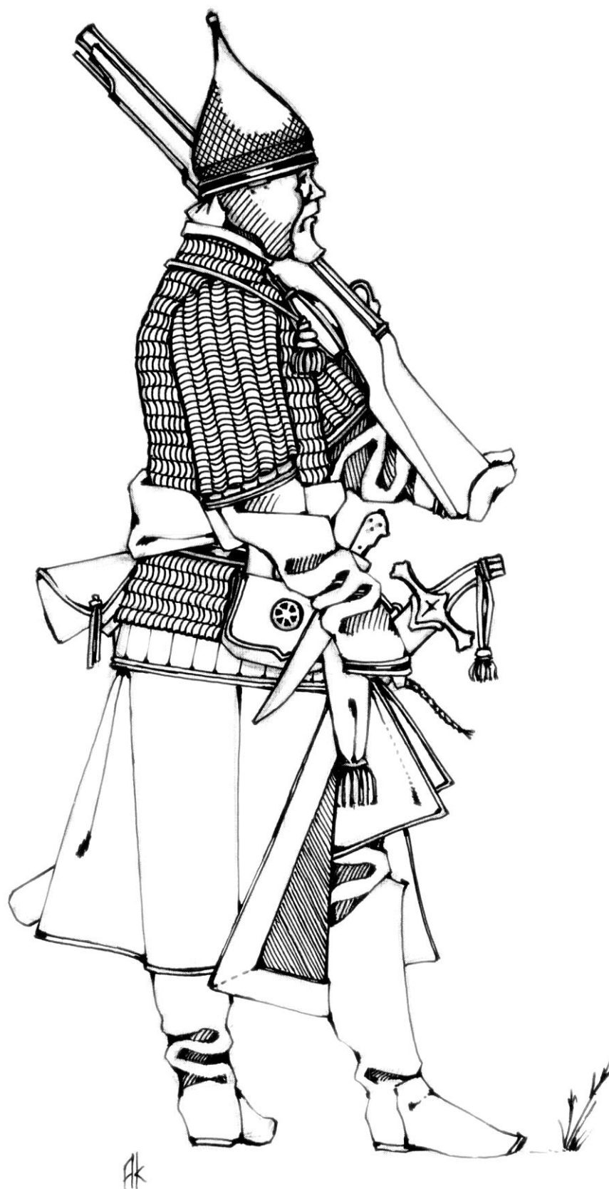
Человек с пищалью осадной "сотни людей боярских", 1550-1570-е гг.