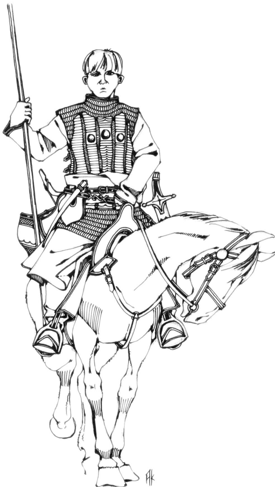
Новик в бехтерце, сер. XVI в.