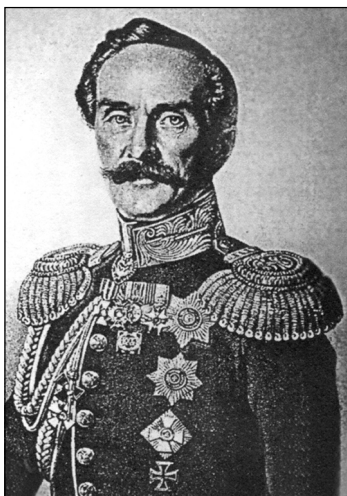
Рис. 2. Малороссийский генерал-губернатор С.А. Кокоскин

По утвержденному штату конно-казацкий полк насчитывал