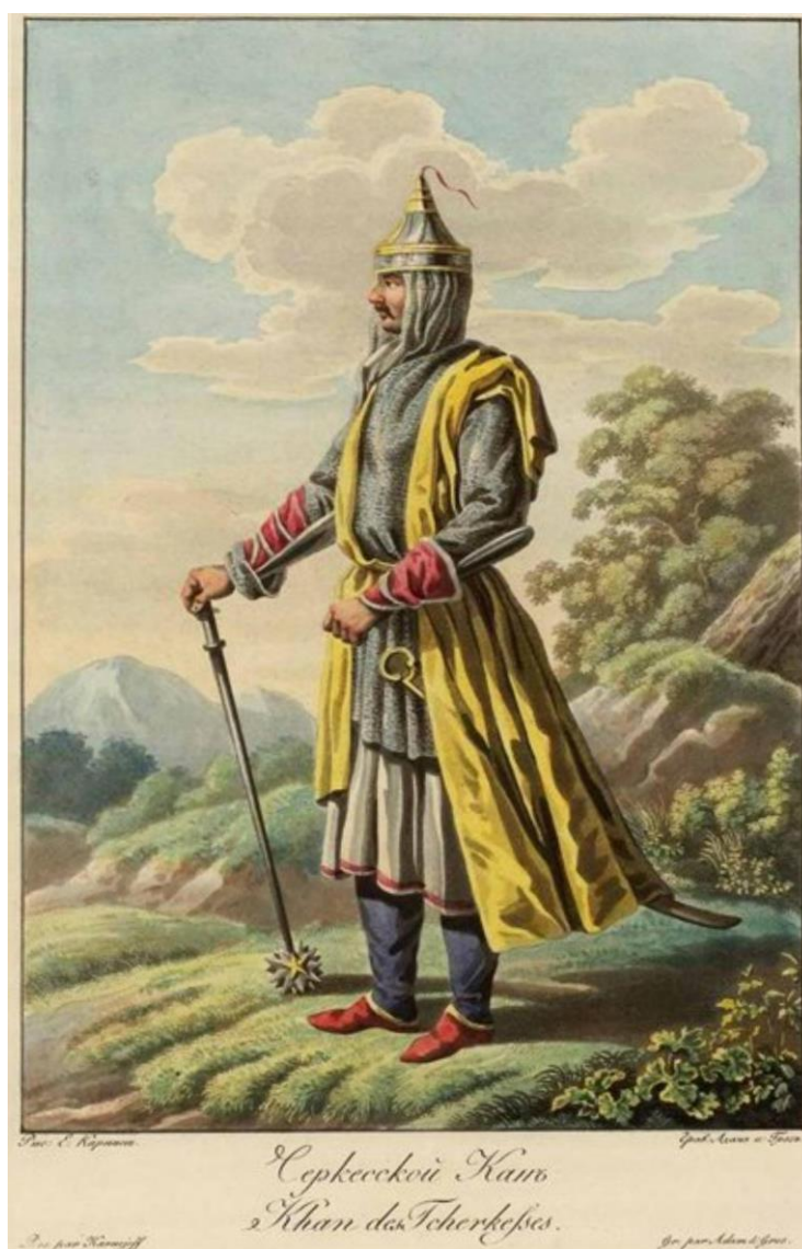
Черкесский князь XVIII в.

претензии на территории, которые когда-то принадлежали Тамерлану. Иранский и кавказский театры военных действий отвлекали на себя внимание