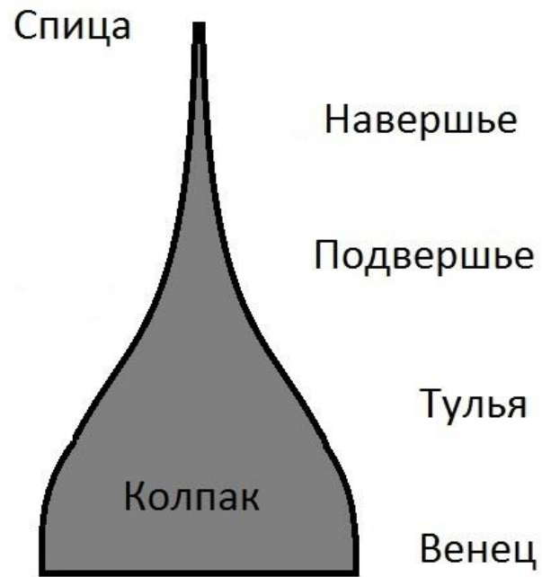
Рис. 1. Устройство шелома