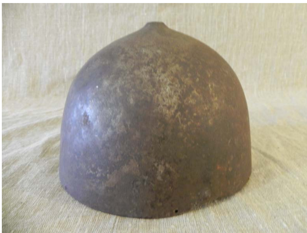
Шапка железная М-426 из Кирилло-Белозерского монастыря 38