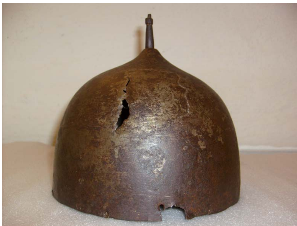
Шапка железная М-422 из Кирилло-Белозерского монастыря 35