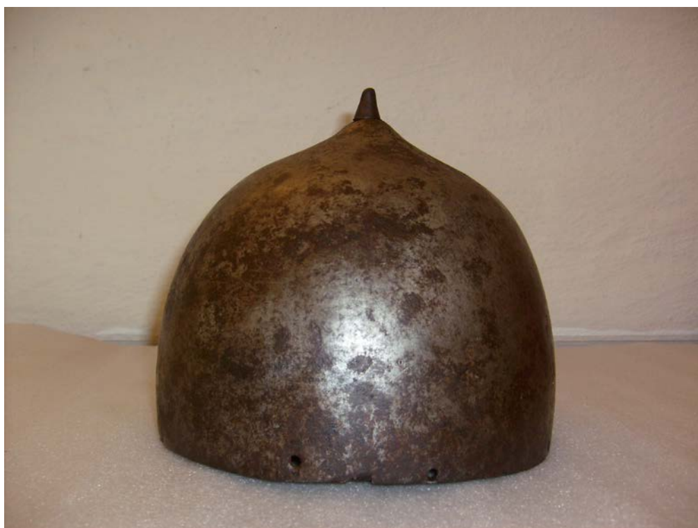
Шапка железная М-603 из Кирилло-Белозерского монастыря 36