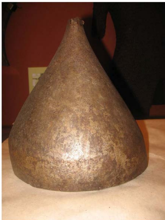
Шелом М-399 из Кирилло-Белозерского Монастыря 34