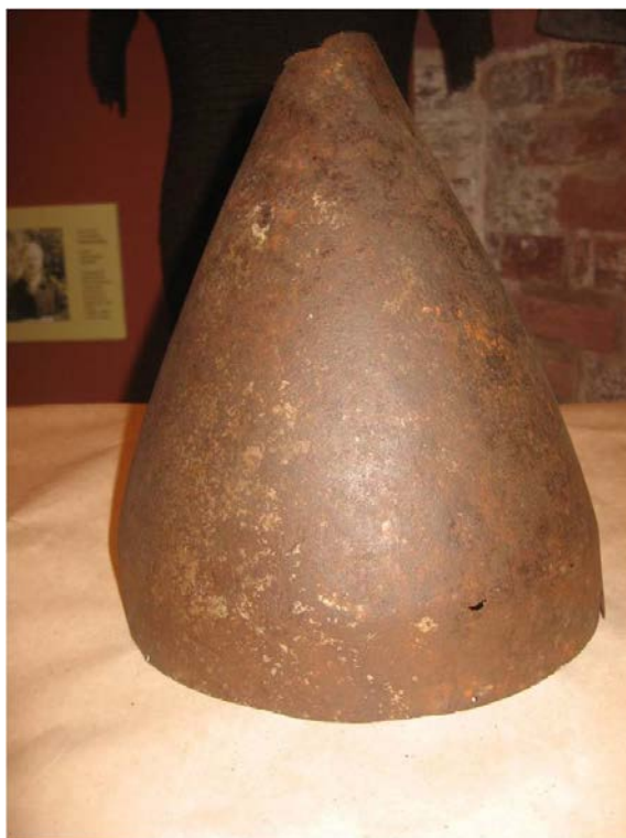
Шелом М-423 из Кирилло-Белозерского Монастыря 33