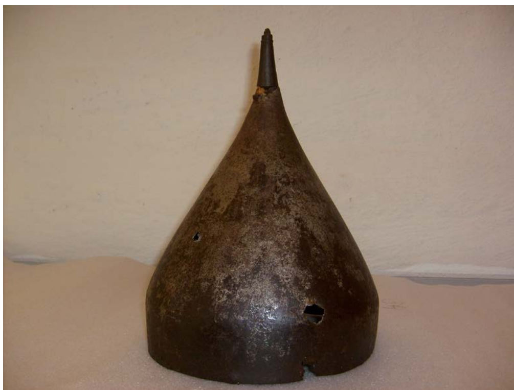
Шелом М-425 из Кирилло-Белозерского Монастыря 32

Наконец, материальная база артефактов позволяет нам четко выделить два вида шлемов, помимо мисюрок. Первый вид – это высокие сфероконические (иногда имеющие высокий венеч цилиндрические или даже конические) шлемы (Фото 1-3), второй вид – более низкие полусферические шлемы, зачастую имеющие небольшое навершие (Фото 4-8). Хождение обоих видов шлемов в XVI веке подтверждено как археологически, так и благодаря предметам, всегда хранившимся в частных и государственных коллекциях. Более того, как установил еще А.Н. Кирпичников, начиная с середины века произошло плавное вытеснение высоких шлемов низкими 29 . Т.е. сфероконические шлемы постепенно были замещены полусферическими, что также подтверждается цифрами из документов (см. выше в таб. 1 и 2). На сегодняшний день нами обнаружено 46 артефактов, которые мы отождествляем с термином «шелом» 30 , и 16 артефактов, которые мы отождествляем с термином «шапка железная» 31 .