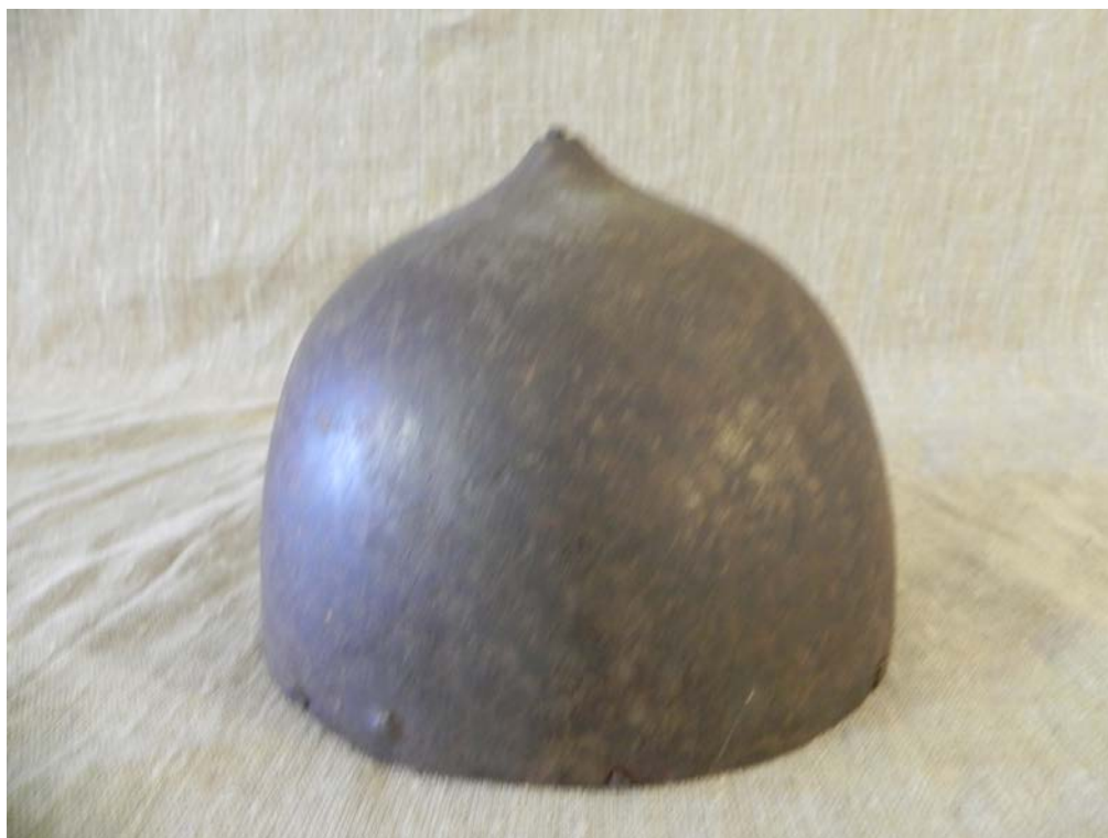
Шапка железная М-791 из Кирилло-Белозерского монастыря 39