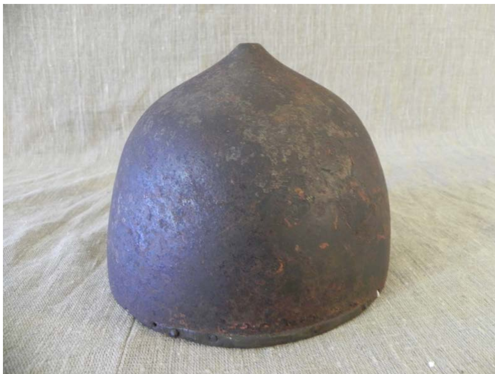
Шапка железная М-424 из Кирилло-Белозерского монастыря 37