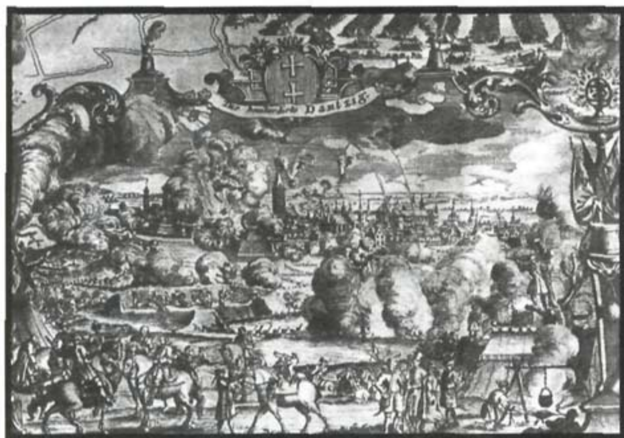
Фрагмент карты осады Данцига

жие, после чего суда русской эскадры должны были отвезти их в один из балтийский портов. Однако, в какой именно порт, оговорено не было. Русские воспользовались этой неточностью и доставили в Кронштадт, где французы содержались в качестве военнопленных до конца войны. В тот же день сдался польский гарнизон Вексельмюнде под командованием капитана Пацерна, и все 468 чел. присягнули на верность королю Августу. Вместе с крепостью русским достались французский фрегат с 30 пушками, гукар с 14 пушками и данцигский прам с 8 пушками. В самих Вестершанце и Вексельмюнде взяты 51 орудие и 2 мортиры и припасы на полгода для 6 тыс. чел. 32 Кроме этого, были получены обратно 3 галиота, захваченные французами.