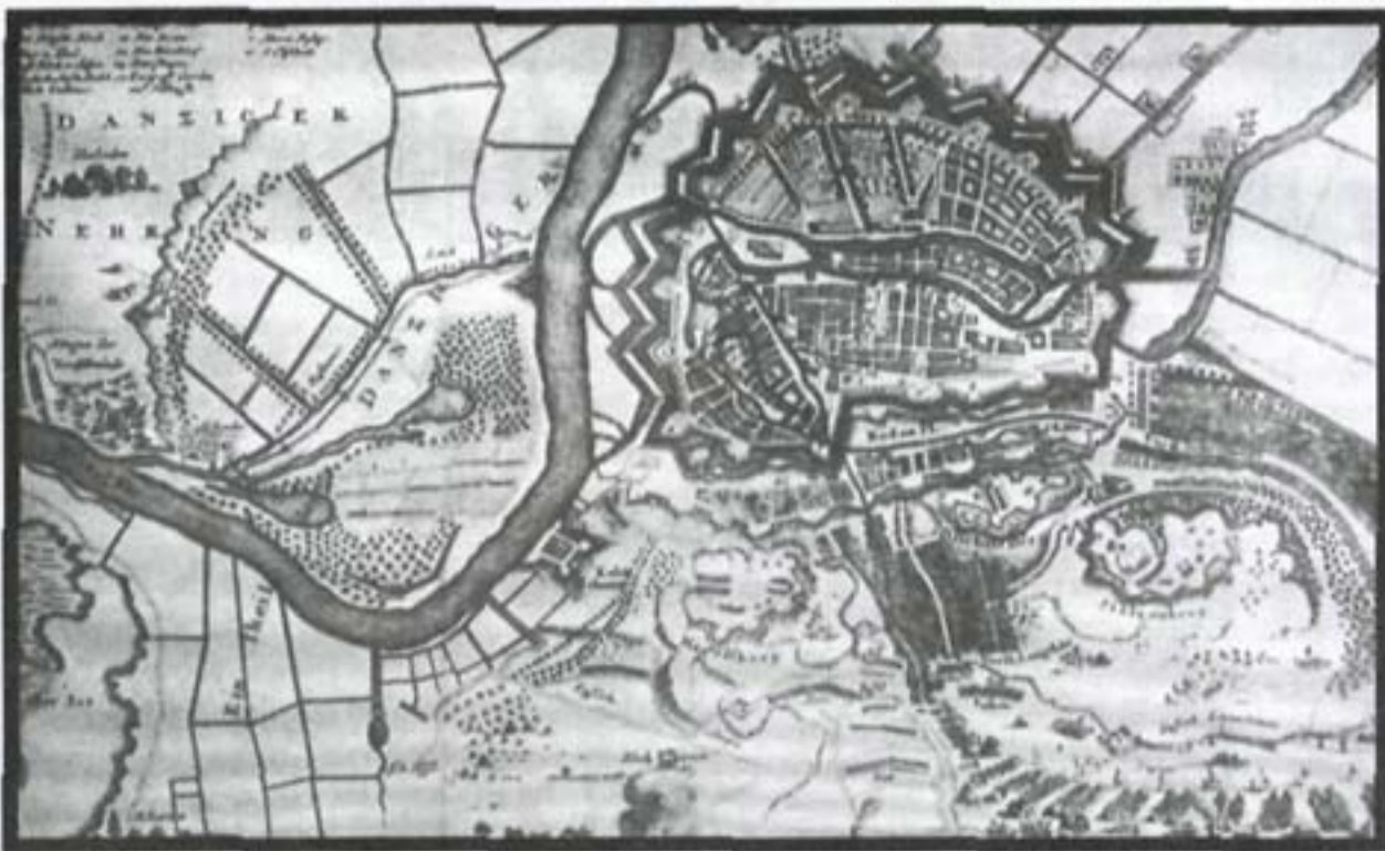
Осада Данцига в 1734 г.

Тем временем у Свеча поляки попытались помешать починке переправы спешенными гренадерами, открыв по ним орудийный огонь из замка и направив к мосту несколько хоругвей кавалерии. В ответ Загряжский выдвинул вперед свои полковые орудия, подавившие польскую артиллерию и прикрывшие ремонт моста. Как только переправа была восстановлена, на другой берег переправились генерал-майор Бирон и полковник Аракчеев с 1000 казаков и драгун. Они сходу атаковали и опрокинули вышедшего из города