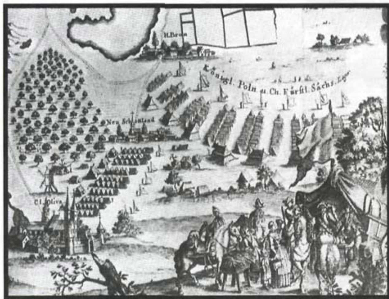
Фрагмент карты осады Данцига