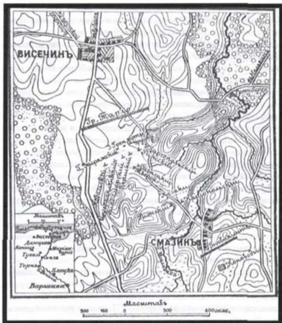
Висечин, карта из Сытинской энциклопедии

неприятеля, положив на месте около 200 и пленив 35 чел. Преследование поляков продолжалось около 4 миль, и было прекращено из-за усталости лошадей, прошедших за день более 12 верст. Согласно показаниям плененных польский отряд состоял из 34 хоругвей польской национальной кавалерии (каждая около 50 чел.), 300 драгун маршалка Мелсинского, 250 кавалеристов нового набора, 80 чел. пехоты и 4 пушек под командованием кастелана Чирского, коронного региментаря Соколинского, генерал-майоров Штейнфлихта и Кампенгаузена. 21 Трофеями Загряжского стали 2 знамени, 3 пары литавр, 1 орудие и 9 лат. Кроме этого, в руки русских в Свече попали все собранные Тарло запасы продовольствия и снаряжения, но основная часть поляков успела отойти на северо-запад к Тухелю. Стремясь выиграть время, Тарло предложил Загряжскому начать переговоры (послав ему 50 золотых "в знак искренности намерений"), а сам тем временем отошел дальше на север к Путцигу. На новой позиции поляки могли угрожать непосредственно тылам русских у Данцига, в частности 8 апреля Миних сообщил о нападении поляков на русских фуражиров под Браунбургом, неподалеку от Эльбинга. 22 Кроме этого, Тарло мог опереться на прибрежные крепости (Эльбинг и пр.) и получать помощь по морю от Швеции и Франции. Миних был очень недоволен Загряжским и приказал Ласси принять командование над конным корпусом и устранить угрозу тылам русской армии.